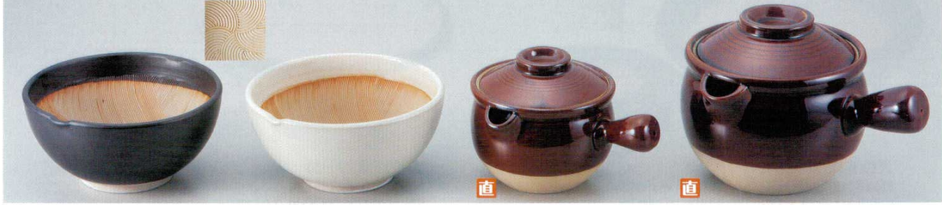
876-26-311 3,000円 黒輪流紋丸型すり鉢6.5号 (20.5×19.3×9.5cm) 0131876026 876-27-311 1,650円 黒輪流紋丸型すり鉢5.5号 (17×16.5×8cm) 0131876027 876-28-311 1,100円 黒輪流紋丸型すり鉢4.2号 (13.5×12.5×6.2cm) 0131876028 876-29-311 810円 黒輪流紋丸型すり鉢3.5号 (11.5×10.5×5.5cm) 0131876029 876-30-311 3,000円 白輪流紋丸型すり鉢6.5号 (20.5×19.3×9.5cm) 0131876030 876-31-311 1,650円 白輪流紋丸型すり鉢5.5号 (17×16.5×8cm) 0131876031 876-32-311 1,100円 白輪流紋丸型すり鉢4.2号 (13.5×12.5×6.2cm) 0131876032 876-33-311 810円 白輪流紋丸型すり鉢3.5号 (11.5×10.5×5.5cm) 0131876033 876-34-311 1,700円 0131876034 アメ行平6号 (14.5×13cm・900cc) 1入 876-35-311 1,450円 0131876035 アメ行平4号 (13.5×11cm・600cc) 1入 876-36-311 2,550円 0131876036 アメ行平12号 (18.5×16.7cm・2000cc) 1入 876-37-311 2,100円 0131876037 アメ行平10号 (17×15.5cm・1500cc) 1入 876-38-311 1,900円 0131876038 アメ行平8号 (16×14.5cm・1200cc) 1入