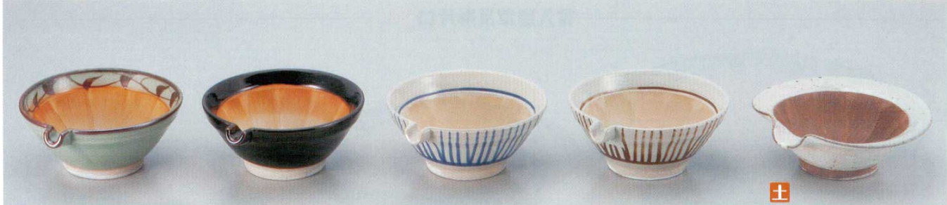
876-01-311 1,080円 0131876001 貴入唐草 片口5.0すり鉢 (16.5×15×6.5cm) 876-02-311 900円 0131876002 貴入唐草 片口4.0すり鉢 (14×12.5×5.5cm) 876-03-311 850円 0131876003 天目片口すり鉢5号 (16.5×15×7cm) 876-04-311 720円 0131876004 天目片口すり鉢4号 (14×12.5×5.7cm) 876-05-311 1,050円 0131876005 ゴス十草片口すり鉢5号 (16.5×15×7cm) 876-06-311 1,050円 0131876006 茶十草片口すり鉢5号 (16.5×15×7cm) 876-07-311 1,700円 0131876007 粉引花型5.5すり小鉢 (17×16.5×6cm) 876-08-311 1,150円 0131876008 粉引花型4.5すり小鉢 (14.5×14×4.8cm)

大鉢 盛鉢 刺身 向付 小鉢 小付 盛鉢 和皿 焼皿 大皿 酒器 蓋 蓋 蓋 井茶碗 土瓶 急須 湯呑 和陶 オープン 耐熱 萬古焼 洋食器 碗皿 中華食器 茶道具 カメ すり鉢 インスタ 木 漆 竹 製品 ガラス 漆器 神仏具