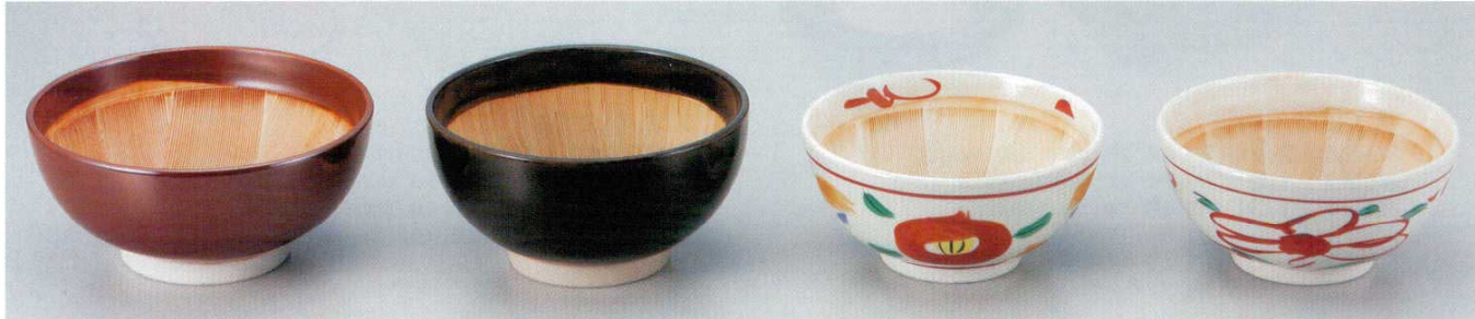
876-16-521 2,600円 0152876016 駄知7号新型すり鉢 (20.6×9.8cm) 876-17-521 1,700円 0152876017 駄知6号新型すり鉢 (18×9cm) 876-18-521 1,200円 0152876018 駄知5号新型すり鉢 (15.3×7.5cm) 876-19-311 3,550円 0131876019 織部丸6.0すり鉢 (19.5×10.5cm) 876-20-311 1,600円 0131876020 織部丸5.0すり鉢 (16×8cm) 876-21-311 800円 0131876021 織部丸4.0すり鉢 (12.5×6.5cm) 876-22-491 2,500円 0149876022 山茶花6.0スリ鉢 (18.5×9cm)25入 876-23-491 1,980円 0149876023 山茶花5.0スリ鉢 (15.3×7.5cm)30入 876-24-491 2,500円 0149876024 万暦6.0スリ鉢 (18×5.9cm)25入 876-25-491 1,980円 0149876025 万暦5.0スリ鉢 (15.5×7.7cm)30入