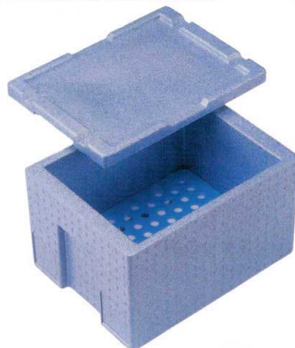
7-129-9 B-7-52 [H.P.P.]長角保温・保冷コンテナ RH-30型 (特深タイプ) (仕切別売) ¥8,850 (外寸46.6×35.4×31.7・内寸39.4×31.4×25)・収納数12個(多用仕切1セット使用時) 24個(多用仕切2セット、中棚板1枚使用時) 梱5