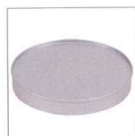
7-129-2 B-3-58 長角保温・保冷コンテナ用蓄熱剤 1ヶ ¥14,300 (20.4φ×3.1) 梱20 ※100℃の湯煎・蒸し器で1時間以上加熱させて下さい。

蓄冷剤 ※外気温30℃、ボックス内予冷10℃で半分料理を入れた場合、蓄冷剤2個でコンテナ内部の保冷10℃約4時間の目安です。