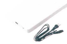
7-129-11 B-4-94 [P.P.]蓄熱剤ヒーター組み込み式 (長角型) 100V 95W 充電式 (約1時間) ¥20,300 (30×17×3) 梱20 ※湯煎式より強力保温 ※水濡れにはご注意下さい