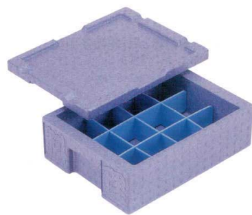
7-129-5 B-3-60 [H.P.P.]長角保温・保冷コンテナ RH-10型 (浅タイプ) (仕切別売) ¥6,200 (外寸47×35.4×17.6・内寸39×31.3×9)・収納数12個(多用仕切1セット使用時) 梱5