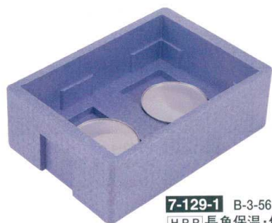
7-129-1 B-3-56 [H.P.P.]長角保温・保冷コンテナ RH-300型 (仕切別売) ¥16,800 (外寸66×46×26) (内寸58×41×16) 梱5

・保温は、60℃以上を3時間以上持続します。(蓄熱剤を本体底に2個セット) ・保冷は、7℃以下を6時間以上持続します。(蓄冷剤を蓋の裏のネットに2個セット)