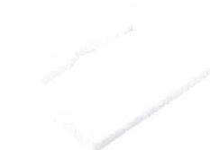
7-129-10 B-4-96 長角保温・保冷コンテナ RH-30型用蓄熱剤受け(白) ¥1,900 (38.8×30.8×3.1) 梱20 ※各種、蓄熱剤のセットにご利用下さい。