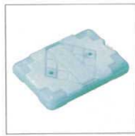
7-129-4 B-3-57 長角保温・保冷コンテナ用蓄冷剤 520g 1ヶ ¥900 (14×19.5×2.5) 梱40 ※-25℃以上の冷凍庫で12時間凍結させて下さい。