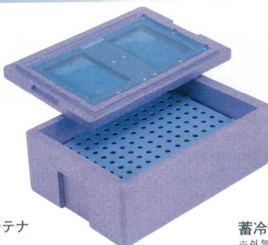
7-129-3 B-3-59 長角保温・保冷コンテナ RH-300型用中棚板 ¥3,000 (57.3×40.5×0.5) 梱100

蓄冷剤 ※外気温30℃、ボックス内予冷10℃で半分料理を入れた場合、蓄冷剤2個でコンテナ内部の保冷10℃約4時間の目安です。