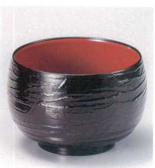
7-172-12 W-13-57 A 宝飯椀 溜内朱塗 ¥1,600 (11.7φ×7.8) 櫃200