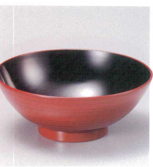
7-172-16 W-13-62 A 茶漬飯椀 赤茶刷毛目 ¥1,150 (14.7φ×5.7) 櫃200