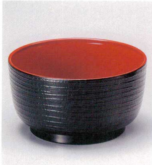
7-172-1 TA 割子飯椀(小) W-13-45 黒 ¥530 (11.4φ×6.2) 櫃200 W-13-46 黒内朱塗 ¥680 (11.4φ×6.2) 櫃200