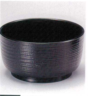
7-172-13 W-13-58 TA 割子飯椀 黒 ¥650 (12.5φ×6.7) 櫃200 W-13-59 TA 割子飯椀 黒内朱塗 ¥720 (12.5φ×6.7) 櫃200