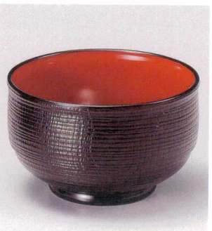
7-172-10 W-13-55 A 助六飯椀 新溜内朱塗 ¥800 (11.5φ×7.2) 櫃200