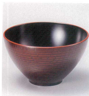
7-172-4 W-13-49 TA 4寸つぼみ木目椀 溜春慶内黒 ¥980 (12φ×6.9) 櫃200