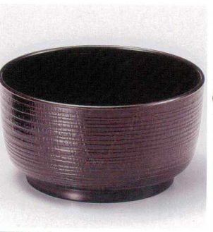
7-172-14 W-13-60 TA 割子飯椀 溜 ¥720 (12.5φ×6.7) 櫃200