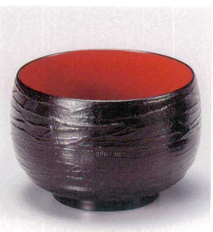
7-172-11 W-13-56 A 宝飯椀 黒内朱塗 ¥1,450 (11.7φ×7.8) 櫃200