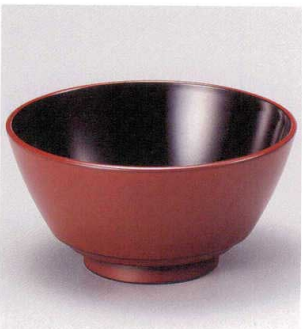
7-172-6 W-13-51 TA 赤坂飯椀 漆調銀朱塗 ¥1,000 (12.2φ×6.2) 櫃200