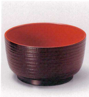
7-172-2 W-13-47 TA 割子飯椀(小) 溜内朱塗 ¥750 (11.4φ×6.2) 櫃200