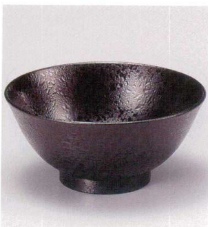
7-172-7 W-13-52 A 刷毛目飯椀 総黒石目 ¥750 (12φ×5.5) 櫃200