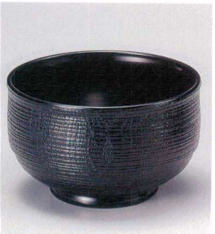
7-172-9 W-13-54 A 助六飯椀 黒 ¥650 (11.5φ×7.2) 櫃200