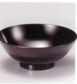
7-172-15 W-13-61 A 茶漬飯椀 黒油滴 ¥950 (14.7φ×5.7) 櫃200