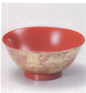
7-172-8 W-13-53 A 刷毛目飯椀 朱金箔内朱塗 ¥1,500 (12φ×5.5) 櫃200