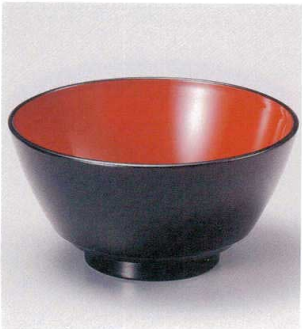
7-172-5 W-13-50 TA 赤坂飯椀 黒内朱 ¥650 (12.2φ×6.2) 櫃200