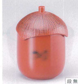
7-180-3 W-9-54 TM なす型小吸椀 根来 ¥2,650 (7.2φ×10) 楕100 180cc