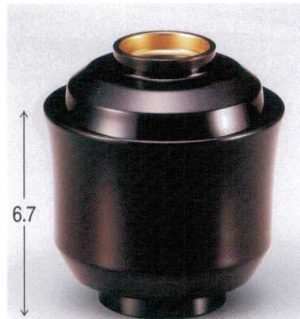
7-180-5 W-10-15 TM 2.6寸京型吸椀 溜つば金 ¥2,100 (7.8φ×8.6) 楕200 160cc