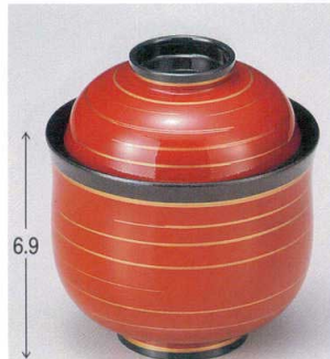
7-180-9 W-11-68 TM ニューひさご小吸椀 朱金ライン ¥2,000 (8.6φ×9.5) 楕100 200cc