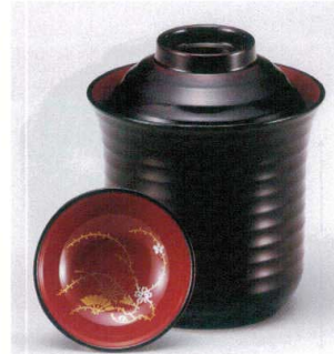
7-180-8 W-10-18 TM 2.5寸平筋箸洗椀 溜内朱見返付 S・H塗 ¥2,500 (7.6φ×8.8) 楕200 170cc