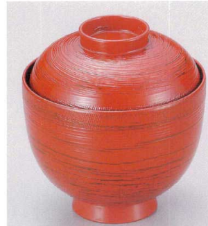
7-180-11 W-8-66 TA 3寸布目筋入椀 朱かすり ¥1,450 (9φ×9.5) 楕100 220cc