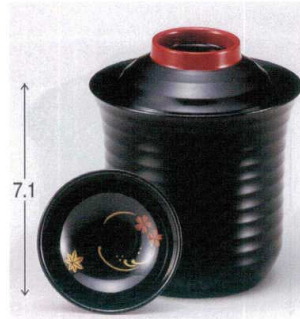
7-180-7 W-10-17 TM 2.5寸平筋箸洗椀 黒つば朱見返付 S・H塗 ¥2,400 (7.6φ×8.8) 楕200 170cc