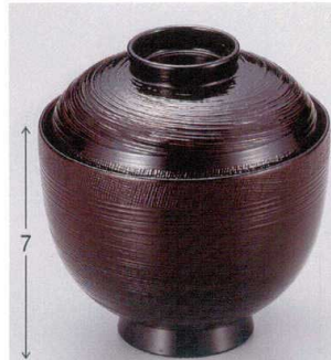
7-180-10 W-8-65 TA 3寸布目筋入椀 溜内朱 ¥1,300 (9φ×9.5) 楕100 220cc