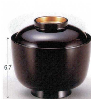
7-180-14 W-10-19 TM 3.1寸日野小吸椀 溜つば金 ¥2,100 (9.4φ×8.9) 楕100 230cc