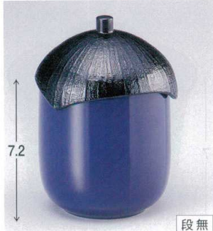
7-180-1 W-9-52 TM なす型小吸椀 紫 ¥2,300 (7.2φ×10) 楕100 180cc