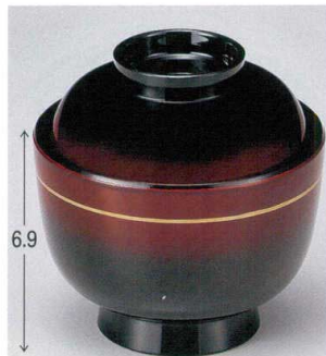
7-180-13 W-11-69 TA 一口古代椀 曙ぼかし金ライン ¥2,000 (9.3φ×9.4) 楕100 210cc