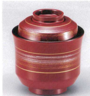
7-180-6 W-10-16 TM 2.6寸京型吸椀 朱金銀かすり ¥2,300 (7.8φ×8.6) 楕200 160cc