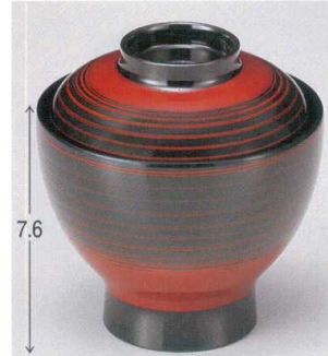
7-180-12 W-11-70 TM 大平小吸椀 溜筋目塗り分け ¥2,000 (9.5φ×9.8) 楕100 220cc