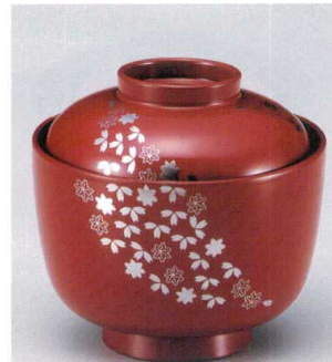
7-180-15 W-10-20 TM 3.1寸日野小吸椀 朱春秋 S・H塗 ¥3,300 (9.4φ×8.9) 楕100 230cc