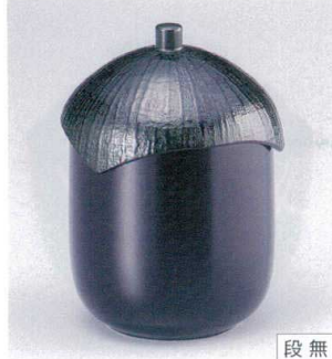
7-180-2 W-9-53 TM なす型小吸椀 黒 ¥2,500 (7.2φ×10) 楕100 180cc