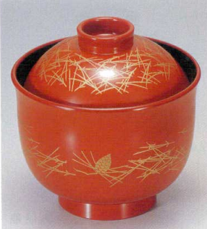
7-185-7 1-155-7 TA 3寸リリー碗 朱松ボックリ ¥2,400 (8.9φ×8.8) 梱200 180cc