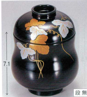
7-185-14 1-155-14 TM ひょうたん小吸碗 黒にツタ S・H塗 ¥3,350 (7φ×9.8) 梱200 190cc