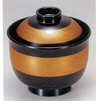
7-185-8 1-155-11 TA 3寸リリー碗 黒金帯松葉 ¥2,800 (8.9φ×8.8) 梱200 180cc