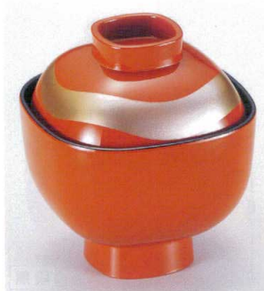
7-185-11 W-4-34 TA 3寸角碗 朱羽衣 S・H塗 ¥2,450 (9.1×9.1×10.2) 梱100 220cc