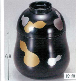
7-185-16 1-155-16 TM 2.7寸ひさご碗 黒ひさご ¥3,400 (8φ×10.4) 梱200 210cc