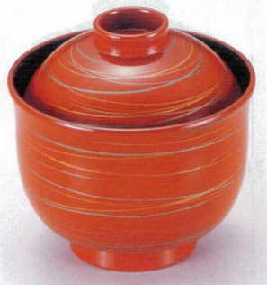
7-185-2 W-4-32 TA 3寸リリー碗 朱あやひも ¥1,900 (8.9φ×8.8) 梱200 180cc