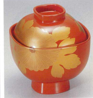
7-185-12 1-182-14 TA 3寸角碗 朱に菊内朱 S・H塗 ¥3,950 (9.1×9.1×10.2) 梱100 220cc