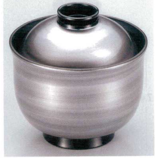
7-185-4 W-9-85 TA 3寸リリー碗 銀渦刷毛目 ¥2,400 (8.9φ×8.8) 梱200 180cc