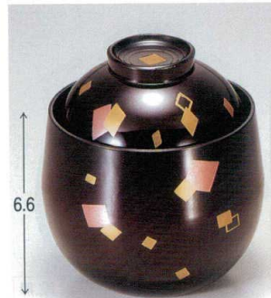
7-185-13 1-155-13 TA (小)びく碗 溜箔ちらし ¥3,550 (8φ×7.7) 梱100 170cc