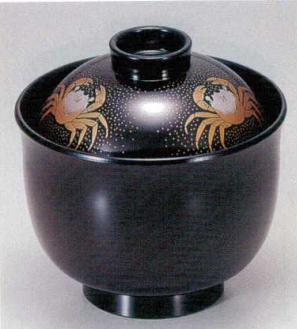
7-185-6 1-155-5 TA 3寸リリー碗 黒かに ¥2,400 (8.9φ×8.8) 梱200 180cc