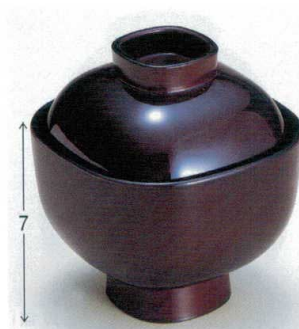
7-185-9 W-3-64 TA 3寸角碗 溜 ¥1,750 (9.1×9.1×10.2) 梱100 220cc