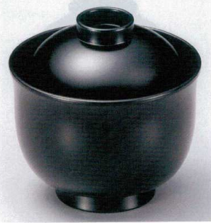
7-185-3 W-9-84 TA 3寸リリー碗 黒 ¥1,400 (8.9φ×8.8) 梱200 180cc