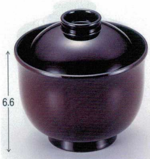
7-185-1 W-4-31 TA 3寸リリー碗 溜 ¥1,500 (8.9φ×8.8) 梱200 180cc