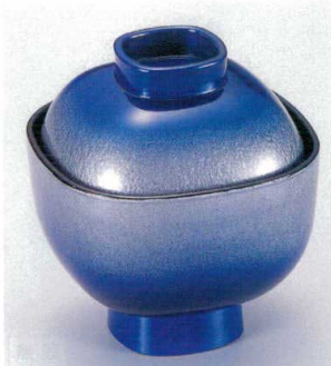
7-185-10 W-3-67 TA 3寸角碗 青雲流 ¥2,050 (9.1×9.1×10.2) 梱100 220cc