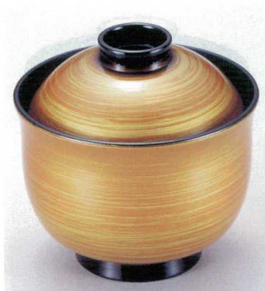
7-185-5 W-3-3 TA 3寸リリー碗 赤はけ流し ¥2,100 (8.9φ×8.8) 梱200 180cc