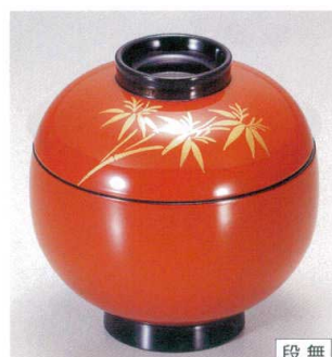
7-200-9 1-162-4 TM 玉姫小吸椀 朱つば黒笹 S・H塗 ¥2,900 (9.2φ×9.5) 楕100 270cc