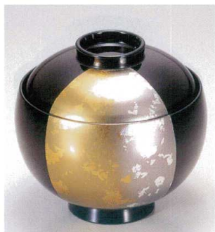
7-200-7 1-162-16 TM 布袋小吸椀 金銀色紙 ¥6,300 (9.8φ×9) 楕100 240cc