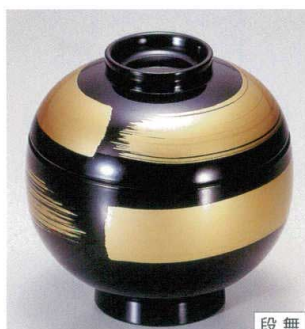
7-200-10 1-162-6 TM 玉姫小吸椀 黒一筆 ¥3,000 (9.2φ×9.5) 楕100 270cc