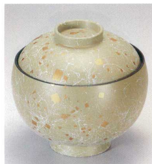
7-200-5 1-162-11 TM 布袋小吸椀 うぐいす和紙塗金箔 ¥3,700 (9.8φ×9) 楕100 240cc