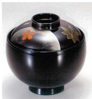
7-200-6 1-162-12 TM 布袋小吸椀 月見春秋 S・H塗 ¥3,800 (9.8φ×9) 楕100 240cc