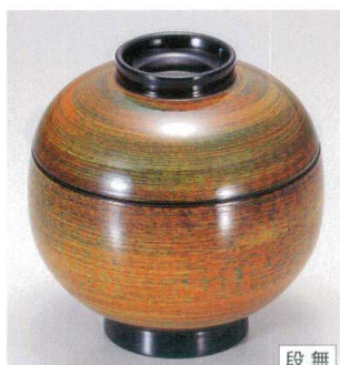
7-200-11 1-162-14 TM 玉姫小吸椀 つむぎ征目 S・H塗 ¥4,300 (9.2φ×9.5) 楕100 270cc