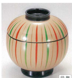
7-200-15 W-11-39 TM てまり吸椀 クリーム十草 S・H塗 ¥4,100 (9.7φ×9.4) 楕100 270cc