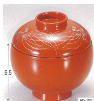
7-200-13 1-162-3 TM てまり吸椀 朱セリ ¥2,550 (9.7φ×9.4) 楕100 270cc