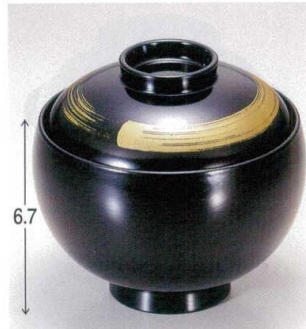
7-200-1 1-162-1 TM 布袋小吸椀 黒一筆 ¥2,150 (9.8φ×9) 楕100 240cc