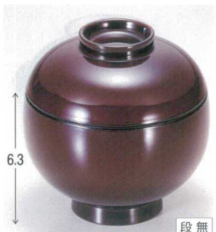
7-200-8 1-162-2 TM 玉姫小吸椀 溜 ¥2,400 (9.2φ×9.5) 楕100 270cc