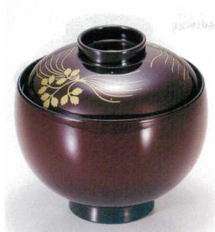
7-200-2 1-162-8 TM 布袋小吸椀 溜セリ S・H塗 ¥2,900 (9.8φ×9) 楕100 240cc