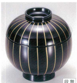
7-200-12 1-162-15 TM 玉姫小吸椀 金十草 S・H塗 ¥4,550 (9.2φ×9.5) 楕100 270cc