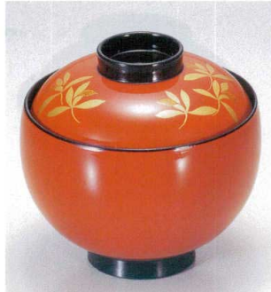
7-200-3 1-162-9 TM 布袋小吸椀 朱ラン S・H塗 ¥3,200 (9.8φ×9) 楕100 240cc