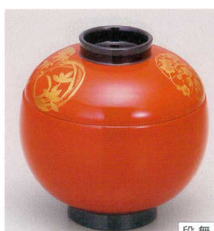
7-200-14 W-11-38 TM てまり吸椀 朱花丸 S・H塗 ¥3,000 (9.7φ×9.4) 楕100 270cc