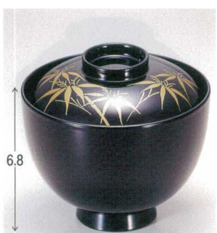
7-200-16 1-162-7 TM 法師椀 黒に笹 S・H塗 ¥2,950 (9.2φ×8.6) 楕100 220cc