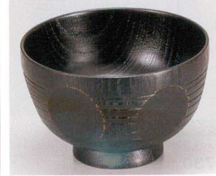
7-248-15 1-189-13 柾汁椀 黒ケヤキ(小) ¥1,250 (11.4φ×6.9) 椀144 320cc