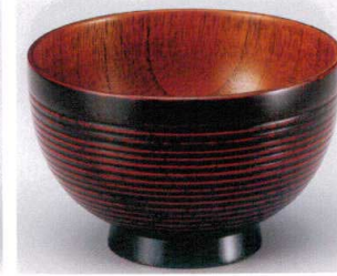
7-248-19 W-10-68 柾木製ロク口筋汁椀 曙内スリ漆 ¥1,450 (11.1φ×7.1) 椀144 320cc