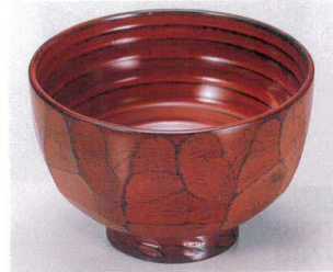
7-248-14 W-2-31 柾亀甲椀 漆根来 ¥1,050 (11φ×7) 椀100 270cc