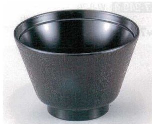
7-248-6 W-6-33 TA 3.3寸布目汁椀 黒 ¥630 (10.4φ×6.5) 椀200 230cc