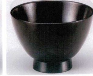
7-248-20 W-10-69 柾木製小町汁椀 黒ケヤキ ¥1,250 (11.6φ×8.1) 椀144 300cc