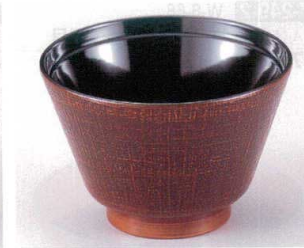
7-248-8 W-6-35 TA 3.3寸布目汁椀 栃 ¥830 (10.4φ×6.5) 椀200 230cc