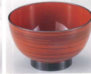
7-248-9 W-6-36 A 4寸彩汁椀 茶刷毛目 ¥1,050 (12.6φ×7.4) 椀100 480cc