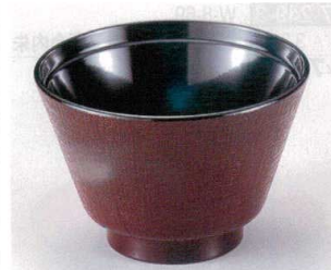
7-248-7 W-6-34 TA 3.3寸布目汁椀 溜 ¥730 (10.4φ×6.5) 椀200 230cc