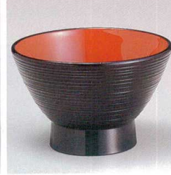
7-248-4 W-2-34 A 3.8寸宝生汁椀 黒内朱 ¥530 (11.7φ×7) 椀100 300cc