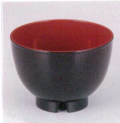
7-248-1 W-12-68 A 新3.2寸汁椀 黒木目内朱 (通気穴付) ¥200 (9.6φ×6.8) 椀400 270cc