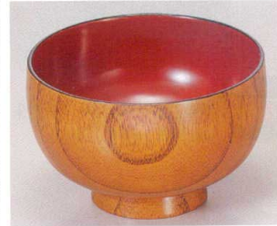
7-248-11 1-189-10 柾木製汁椀 スリ漆内朱 ¥750 (11φ×7) 椀144 310cc