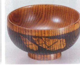
7-248-16 1-189-15 柾汁椀 ケヤキ竹の子 ¥1,300 (12φ×6.7) 椀120 360cc