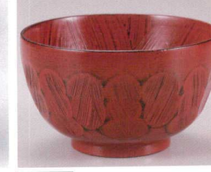
7-248-21 W-14-61 柾木製多用亀甲井 漆一筆根来 ¥3,700 (13.7φ×8.1) 椀50 610cc