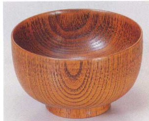
7-248-10 1-189-8 柾木製(小)汁椀 スリ漆 ¥650 (11φ×6.5) 椀144 250cc