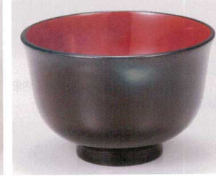
7-248-12 W-14-62 柾木製羽反椀 溜内朱 ¥920 (10.9φ×6.7) 椀144 270cc