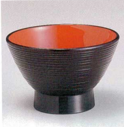
7-248-2 W-2-32 A 3.6寸宝生汁椀 黒内朱 ¥480 (11φ×7) 椀100 260cc