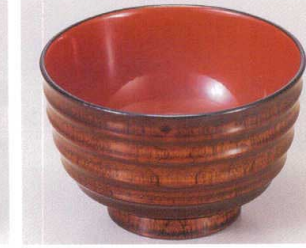
7-248-13 1-189-12 柾木製羽反ロク口椀 木目漆内朱 ¥980 (11φ×7) 椀144 280cc