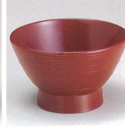
7-248-5 W-2-35 A 3.8寸宝生汁椀 吟朱 ¥530 (11.7φ×7) 椀100 300cc