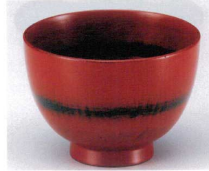
7-248-18 W-10-67 柾ミニ汁椀 根来 ¥1,450 (9.9φ×7.1) 椀144 250cc