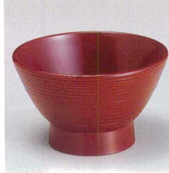
7-248-3 W-2-33 A 3.6寸宝生汁椀 吟朱 ¥480 (11φ×7) 椀100 260cc