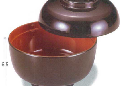
7-304-6 TA 洗琳椀 溜内朱 W-6-85 ¥1,750 (11.9φ×9.4・内寸11.4φ×5.4) 櫃100 280cc