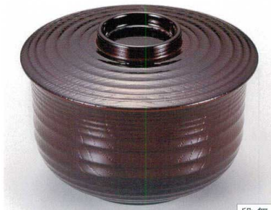
7-304-5 TA かぶせ木目飯器 溜内朱 W-7-98 ¥1,200 (12.5φ×8.8・内寸11.1φ×6.5) 櫃100 550cc