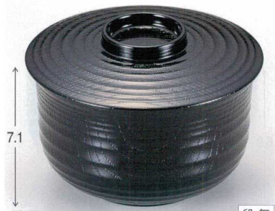
7-304-4 TA かぶせ木目飯器 黒 W-7-99 ¥900 (12.5φ×8.8・内寸11.1φ×6.5) 櫃100 550cc