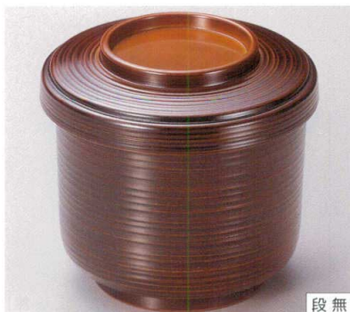
7-304-12 A 荒筋飯器 柝内朱 W-8-4 ¥1,750 (11.1φ×10.1・内寸9.3φ×7.9) 櫃100 580cc