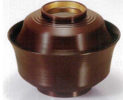
7-304-3 TA 4.5寸竹型椀 溜つば金内黒塗 1-223-12 ¥2,600 (13.5φ×10.2・内寸13.2φ×5.7) 櫃100 380cc