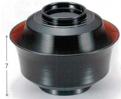
7-304-1 TA 4.5寸竹型椀 黒内朱 W-7-68 ¥2,150 (13.5φ×10.2・内寸13.2φ×5.7) 櫃100 380cc