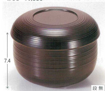
7-304-13 M 4寸小太郎飯器 溜内朱 1-228-3 ¥1,900 (12.5φ×9.3・内寸9.5φ×6.2) 櫃100 590cc