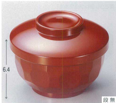
7-304-8 TA 3.5寸浅型亀甲飯器 溜内朱 W-8-1 ¥1,800 (11.4φ×8.3・内寸9.8φ×5.4) 櫃100 320cc