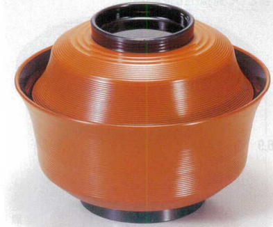
7-304-2 TA 4.5寸竹型椀 朱つば黒内黒塗 1-223-11 ¥2,400 (13.5φ×10.2・内寸13.2φ×5.7) 櫃100 380cc