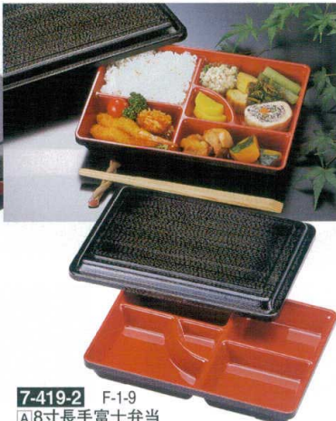
7-419-2 F-1-9 A 8寸長手富士弁当 黒木目内朱 (固定仕切) ¥1,750 (25.5×18.4×5.4) 櫃40