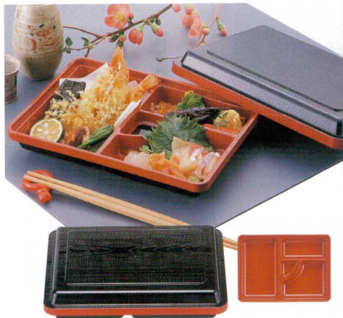
7-419-1 A 行楽弁当 黒新木目 黒朱内朱 1-412-1 ¥1,750 (25×18.1×6) 櫃40