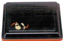
7-419-7 1-412-3 A 赤坂弁当 黒新木目 なす内朱 ¥2,300 (25×25×5.8) 櫃40