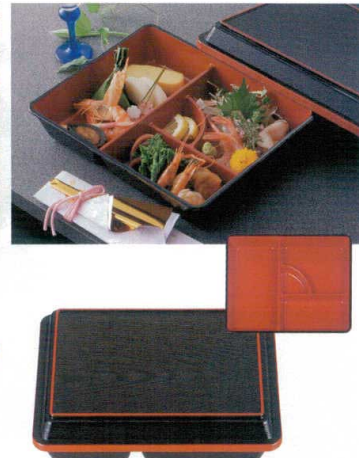
7-419-3 A ニューランチ弁当 黒朱内朱 1-412-5 ¥1,750 (25.1×20×6.7) 櫃50