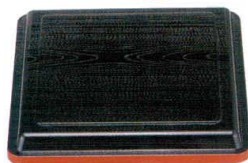
7-419-6 1-412-2 A 赤坂弁当 黒新木目 黒朱内朱 ¥2,050 (25×25×5.8) 櫃40