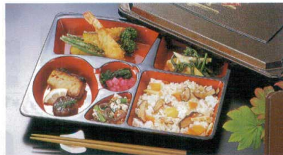
7-419-12 1-413-5 A 尺0寸隅切給食弁当 パール若松 ¥3,150 (29.5×24×5.4) 櫃30