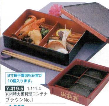
8寸長手隅切松花堂が10個入ります。 7-419-5 1-111-4 P.P.特大御料理コンテナ ブラウンNo.1 ¥4,960 外寸 (67.5×52.5×14.5) 内寸 (61.5×49×14) 櫃10