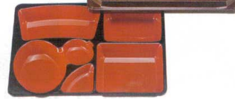
7-419-13 1-413-4 A 尺0寸隅切給食弁当 梨地扇面 ¥3,150 (29.5×24×5.4) 櫃30