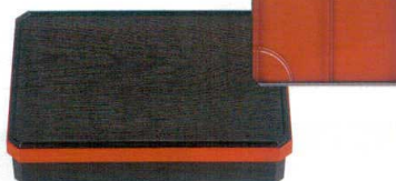
7-419-8 1-412-6 A 8寸長手隅切松花堂 黒朱内朱 ¥1,450 (24.8×18.5×5.5) 櫃40