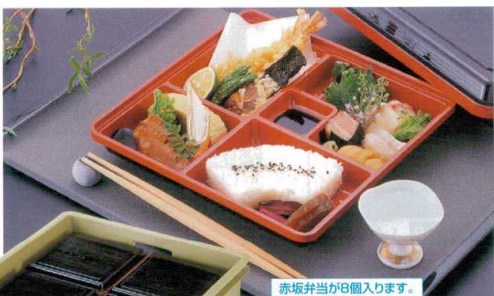
赤坂弁当が8個入ります。 7-419-4 1-113-6 P.P.鉢盛コンテナノンスリップ加工 ¥7,000 外寸 (56×56×16) 内寸 (51.5×51.5×14.8) 櫃5