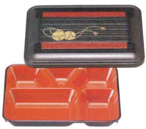
7-422-5 1-419-1 TA T-183 (小) 8寸長手副食弁当 パール鈴内朱 ¥2,150 (23.1×17.2×4.9) 梱10