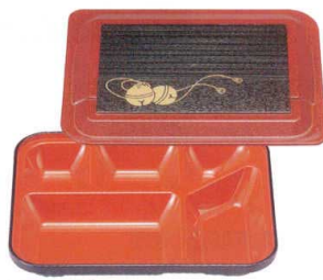
7-422-6 1-419-2 TA T-187 (低型) (大) 8寸長手副食弁当 パール鈴内朱 ¥2,550 (23.3×18.1×4.9) 梱40