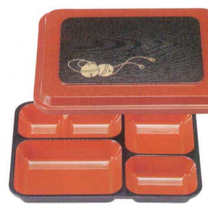
7-422-12 1-419-5 TA T-182 (大) 9寸長手副食弁当 パール鈴内朱 ¥2,950 (27×21×5.4) 梱40