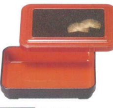
7-422-8 H-127-5 TA F-161 ライス入れ 朱パール松葉内朱 ¥1,500 (17.7×12.4×4.3) 梱100