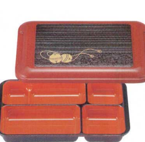
7-422-11 1-419-4 TA T-190 (小) 9寸長手副食弁当 パール鈴内朱 ¥2,700 (26.7×17.5×5.1) 梱40