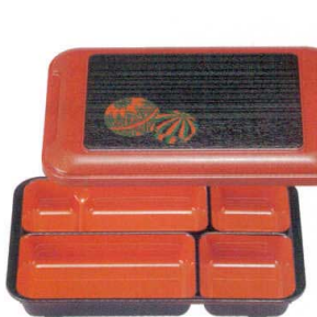
7-422-9 1-418-4 TA T-190 (小) 9寸長手副食弁当 まり内朱 ¥2,700 (26.7×17.5×5.1) 梱40