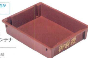
7-422-15 1-111-8 P.P.WF-300 コンテナ ベージュ ¥3,600 外寸 (71.3×42×17) 内寸 (66.4×37.7×16.4) 梱10 (小) 8寸長手副食弁当が15個入ります。