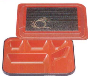
7-422-2 1-418-2 TA T-187 (低型) (大) 8寸長手副食弁当 柳結び内朱 ¥2,550 (23.3×18.1×4.9) 梱40