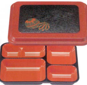
7-422-10 1-418-5 TA T-182 (大) 9寸長手副食弁当 まり内朱 ¥2,950 (27×21×5.4) 梱40