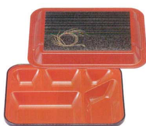
7-422-3 1-418-3 TA T-187 (深型) (大) 8寸長手副食弁当 柳結び内朱 ¥2,600 (23×18×6.7) 梱40