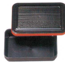
7-422-4 F-2-34 TA F-161 ライス入れ 黒パール内朱 ¥1,200 (17.7×12.4×4.3) 梱100