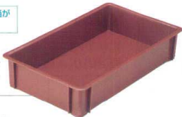
7-422-13 1-111-3 P.P.No.4 コンテナ ブラウン ¥2,900 外寸 (68×40×13.5) 内寸 (63.7×36.3×12.4) 梱10