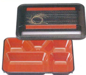
7-422-1 1-418-1 TA T-183 (小) 8寸長手副食弁当 柳結び内朱 ¥2,150 (23.1×17.2×4.9) 梱40