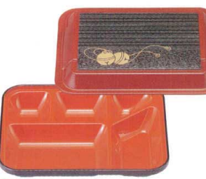
7-422-7 1-419-3 TA T-187 (深型) (大) 8寸長手副食弁当 パール鈴内朱 ¥2,600 (23×18×6.7) 梱40