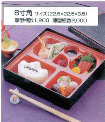
8寸角 サイズ(22.5×22.5×3.5) 厚型梱数1,200 薄型梱数2,000