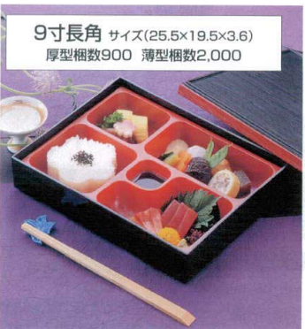
9寸長角 サイズ(25.5×19.5×3.6) 厚型梱数900 薄型梱数2,000