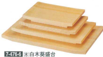
7-476-6 栴 白木 葵盛台 1-743-15 7寸 ¥3,750 (21.2×12.1×2.7) 楕20 1-743-16 8寸 ¥4,300 (24.2×15.2×2.7) 楕15 1-743-17 9寸 ¥5,900 (27.2×18×2.7) 楕10 1-743-18 尺0寸 ¥6,950 (30.2×18×2.7) 楕8