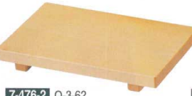
7-476-2 O-3-62 栴(大) 木製長角 マナ板 ¥1,750 (17×9.8×2) 楕40