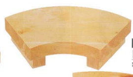
7-476-14 1-742-29 栴 扇 盛皿 ¥5,000 (24×15×6) 楕15