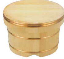
7-476-20 栴 江戸 びつ 1-745-10 7合用 ¥20,600 (24φ×16.5) 楕6 1-745-11 1升用 ¥25,500 (27φ×18) 楕4 1-745-12 1.5升用 ¥30,000 (30φ×20) 楕4 1-745-13 2升用 ¥44,000 (33φ×21) 楕3 1-745-14 3升用 ¥47,000 (36φ×23) 楕3 1-745-15 4升用 ¥68,000 (39φ×24) 楕2 1-745-16 5升用 ¥76,500 (42φ×26) 楕2