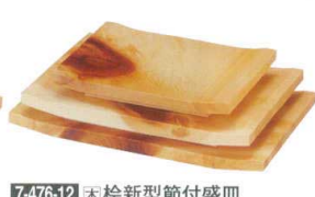
7-476-12 栴 桧 新型 節付 盛皿 1-743-3 7寸 ¥4,100 (21×15×3) 楕30 1-743-4 8寸 ¥4,300 (24×15×3) 楕20 1-743-5 9寸 ¥5,300 (27×18×3) 楕20 1-743-6 尺0寸 ¥7,050 (30×18×3) 楕20 1-743-7 尺2寸 ¥10,550 (36×24×3) 楕10 1-743-8 尺5寸 ¥17,300 (45×30×3) 楕10