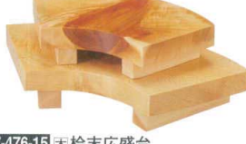
7-476-15 栴 桧 末広 盛台 1-742-17 (小) ¥4,700 (26×15×6) 楕15 1-742-18 (大) ¥7,700 (35×18×6) 楕10