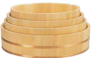
7-476-19 栴 さわら 飯切 1-745-1 尺2寸 ¥9,900 (36φ×9) 楕6 1-745-2 尺4寸 ¥12,500 (42φ×10) 楕5 1-745-3 尺6寸 ¥25,600 (48φ×11) 楕4 1-745-4 尺8寸 ¥34,000 (54φ×13) 楕3 1-745-5 2尺 ¥39,200 (60.7φ×16.2) 楕2 1-745-6 2尺2寸 ¥46,000 (67.5φ×17.7) 楕2 1-745-7 2尺4寸 ¥62,000 (72.3φ×17.5) 楕2 1-745-8 2尺5寸 ¥72,000 (75.7φ×17.6) 楕2 1-745-9 2尺6寸 ¥82,500 (79φ×19.5) 楕2