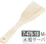
7-476-18 M-4-25 栴 桧 サーバー (大) 30cm 直送 ¥900 (29) 楕100