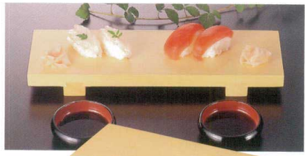
7-476-5 O-3-65 栴 木製長角特大 マナ板 (2人用) ¥4,400 (34.8×11×3.5) 楕20