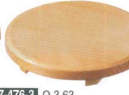
7-476-3 O-3-63 栴 木製丸盛台 ¥2,400 (13.2φ×2) 楕40