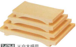
7-476-8 栴 白木 盛皿 1-742-13 7寸 ¥3,700 (21×12×3) 楕20 1-742-14 8寸 ¥4,600 (24×15×3) 楕15 1-742-15 9寸 ¥5,600 (27×18×3) 楕10 1-742-16 尺0寸 ¥7,700 (30×21×3) 楕8