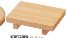
7-476-4 O-3-64 栴(小) 木製寿司ゲタ ¥1,350 (12×9×3) 楕80