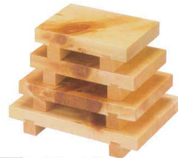
7-476-10 栴 節付 マナ板 1-742-23 7寸 ¥3,920 (21×15×6) 楕20 1-742-24 8寸 ¥4,650 (24×15×6) 楕15 1-742-25 9寸 ¥6,050 (27×18×6) 楕10 1-742-26 尺0寸 ¥9,750 (30×21×6) 楕8