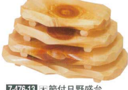
7-476-13 栴 節付 日野 盛台 1-743-19 7寸 ¥4,550 (21.3×12.5×4) 楕20 1-743-20 8寸 ¥5,600 (24.3×15.2×4) 楕15 1-743-21 9寸 ¥7,200 (27×18.3×4) 楕10 1-743-22 尺0寸 ¥9,100 (29.9×18.3×4) 楕8