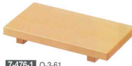
7-476-1 O-3-61 栴(中) 木製長角 マナ板 ¥1,650 (16×9×2) 楕40