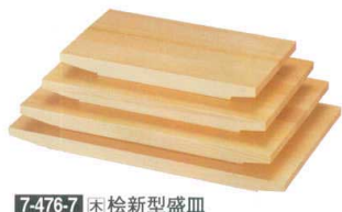
7-476-7 栴 桧 新型 盛皿 1-742-1 7寸 ¥4,300 (21×15×3) 楕30 1-742-2 8寸 ¥4,450 (24×15×3) 楕20 1-742-3 尺0寸 ¥7,050 (30×18×3) 楕20 1-742-4 尺2寸 ¥10,550 (36×24×3) 楕10 1-742-5 尺5寸 ¥17,700 (45×30×3) 楕10