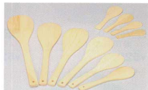
7-476-21 栴 桧 杓子 直送 M-4-15 16cm ¥400 (16) 楕100 M-4-16 19cm ¥440 (18) 楕100 M-4-17 21cm ¥450 (21) 楕100 M-4-18 24cm ¥780 (24) 楕100 M-4-19 29cm ¥980 (29) 楕100 M-4-20 35cm ¥1,400 (35) 楕50 M-4-21 45cm ¥2,800 (45) 楕50 M-4-22 48cm ¥3,000 (48) 楕50 M-4-23 51cm ¥3,800 (51) 楕50 M-4-24 60cm ¥5,100 (60) 楕50