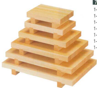
7-476-9 栴 白木 盛台 1-742-6 7寸 ¥3,250 (21×15×6) 楕20 1-742-7 8寸 ¥4,300 (24×15×6) 楕15 1-742-8 尺0寸 ¥7,150 (30×18×6) 楕8 1-742-9 尺2寸 ¥11,000 (36×24×7) 楕6 1-742-10 尺4寸 ¥15,750 (42×27×7) 楕4 1-742-11 尺5寸 ¥19,150 (45×30×7) 楕3 1-742-12 尺6寸 ¥24,500 (48×33×7) 楕2