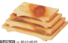
7-476-11 栴 節付 盛皿 1-742-19 7寸 ¥3,700 (21×12×3) 楕20 1-742-20 8寸 ¥4,550 (24×15×3) 楕15 1-742-21 9寸 ¥6,200 (27×18×3) 楕10 1-742-22 尺0寸 ¥8,650 (30×21×3) 楕8