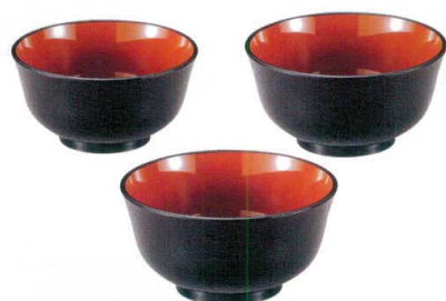
7-526-6 [A] 羽反型丼 黒刷毛目内朱