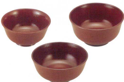
7-526-5 [A] 羽反型丼 内外溜刷毛目