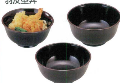
7-526-4 [A] 羽反型丼 黒天うるみ