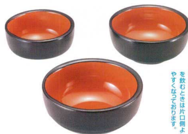
7-526-3 [A] 片口鉢 黒刷毛目内朱