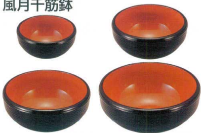
7-526-2 [A] 風月千筋鉢 黒内朱