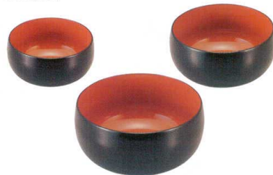
7-526-7 [A] 太鼓鉢 黒刷毛目内朱