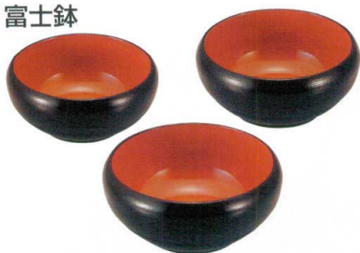
7-526-1 [A] 富士鉢 黒刷毛目内朱