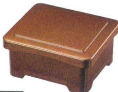
7-550-14 U-1-10 [A] (小) 象足井重 梨地内朱塗 ¥1,180 (14.2×12.5×7) 櫃60