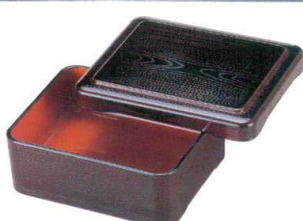
7-550-3 [A] 爪掛新木目井重 溜内朱塗 1-570-4 ¥1,600 (15.8×13×6.4) 櫃60