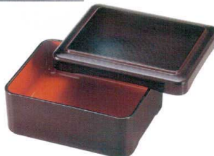
7-550-4 [A] 爪掛千筋井重 溜内朱塗 1-570-3 ¥1,600 (15.8×13×6.4) 櫃60