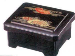
7-550-15 U-1-45 [A] (小) 象足井重 茶パール扇面内朱塗 ¥1,450 (14.2×12.5×7) 櫃60