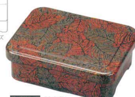
7-550-8 U-1-54 [A] 隅丸爪掛井重 木の葉内朱 ¥3,800 (17.7×13.7×6.3-内寸15.3×11.2×4.3)