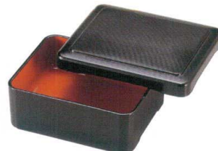
7-550-1 [A] 爪掛千筋井重 黒内朱塗 1-570-1 ¥1,450 (15.8×13×6.4) 櫃60