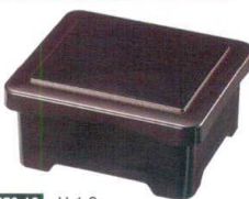
7-550-13 U-1-9 [A] (小) 象足井重 溜内朱塗 ¥1,300 (14.2×12.5×7) 櫃60