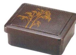
7-550-5 [A] 爪掛千筋井重 パール若竹内朱塗 1-570-5 ¥1,650 (15.8×13×6.4) 櫃60