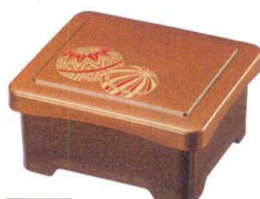
7-550-16 U-1-44 [A] (小) 象足井重 梨地まり内朱塗 ¥1,450 (14.2×12.5×7) 櫃60