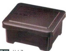
7-550-11 U-1-7 [A] (小) 象足井重 新木目溜内朱塗 ¥1,300 (14.2×12.5×7) 櫃60