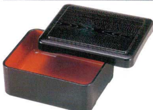
7-550-2 [A] 爪掛新木目井重 黒内朱塗 1-570-2 ¥1,450 (15.8×13×6.4) 櫃60