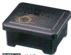
7-550-12 U-1-8 [A] (小) 象足井重 新木目柳結び内朱塗 ¥1,400 (14.2×12.5×7) 櫃60