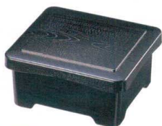
7-550-10 [A] (小) 象足井重 U-1-6 新木目黒内朱塗 ¥1,200 (14.2×12.5×7) 櫃60