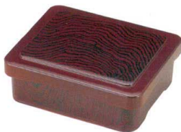
7-550-6 [A] 爪掛井重 ケヤキ木目内朱塗 1-570-6 ¥2,000 (16×13×6) 櫃60