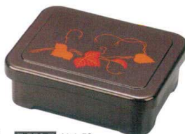
7-550-7 U-1-53 [A] 隅丸爪掛井重 茶パールツタ内朱 ¥2,350 (17.7×13.7×6.3-内寸15.3×11.2×4.3)