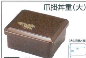
7-550-9 1-570-7 [A] (大) 爪掛井重 梨地笹内朱塗 ¥2,500 (17.3×14.9×8.3) 櫃60