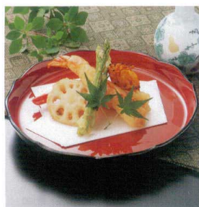
7-651-24 M-5-40 [A] みやこ丸盛皿 緑雲流 ¥1,900 (24.3φ×2.9) 梱80