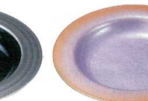
7-651-25 M-8-17 [M] (小)花型盛皿 黒内朱 ¥2,450 (20.5φ×3) 梱80