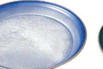
7-651-20 M-2-67 [麻木] 多面皿 漆溜 ¥6,200 (17.5φ×1.4) 梱100