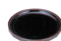
6-822-19 M-8-26 [A] 8寸多用皿 黒内銀渦 ¥2,000 (24.3φ×3.8) 梱80