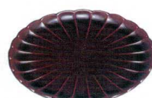
7-651-1 1-652-7 [A] 丸菊皿 朱天黒 ¥1,150 (21φ×3.4) 梱80