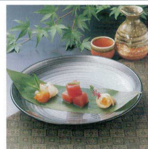
7-651-16 1-635-2 [A] 8寸丸皿 網代溜 ¥2,000 (22.8φ×3.2) 梱50