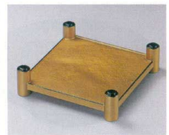
7-663-6 0-3-60 A 角水月皿 金雲天黒 本体 ¥2,100 (17.6×17.6×4.9) 梱60