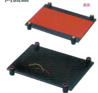
7-663-14 1-631-3 A 両面皿 露草裏朱ライン ¥2,450 (21.3×16.3×2.8) 梱60