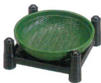
7-663-2 1-630-22 A 丸竹皿 グリーン (脚別売) ¥850 (13.2φ×3.5) 梱200