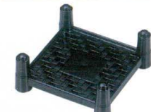
7-663-1 1-630-21 A 天山盛器 脚 黒塗 ¥950 (13×13×5.3) 梱80