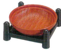
7-663-3 1-630-23 A 丸竹皿 春慶 (脚別売) ¥1,100 (13.2φ×3.5) 梱200