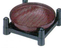
7-663-4 1-630-24 A 丸竹皿 溜 (脚別売) ¥1,100 (13.2φ×3.5) 梱200