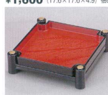
7-663-7 1-630-2 M 角水月板 朱木目 (本体別売) ¥1,900 (16.9×16.9×2.1) 梱50