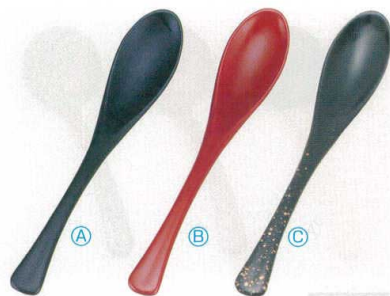
7-874-1 PBT かゆスプーン (19.5×3.4) 梱500 A H-60-16 つや消黒 ¥600 B H-60-17 つや消朱 ¥600 C H-60-18 黒金たたき ¥800