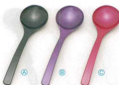
7-874-10 A お玉スプーン (20×5.7) 梱500 A H-60-37 黒/パール ¥800 B H-60-38 紫/パール ¥800 C H-60-39 ワインパール ¥800