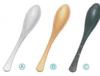
7-874-5 A (小)かゆスプーン (16×2.8) 梱500 A H-60-25 銀塗 ¥600 B H-60-26 金塗 ¥600 C H-60-27 黒色紙金箔 ¥900