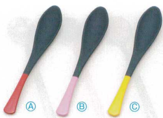
7-874-7 A (小)かゆスプーン (16×2.8) 梱500 A H-60-31 黒/赤 ¥580 B H-60-32 黒/ピンク ¥580 C H-60-33 黒/黄 ¥580