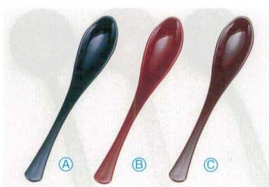
7-874-4 (小)かゆスプーン (16×2.8) 梱500 A H-1-19 AC 黒 ¥220 B H-1-20 AC 朱 ¥220 C H-9-35 A 新溜 ¥370