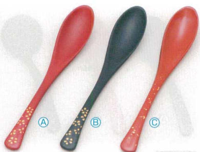
7-874-2 PBT かゆスプーン (19.5×3.4) 梱500 A H-60-19 朱に金花 ¥900 B H-60-20 黒に金花 ¥900 C H-60-21 朱色紙金箔 ¥1,100