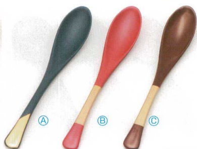
7-874-3 PBT かゆスプーン (19.5×3.4) 梱500 A H-60-22 黒に柄金 ¥900 B H-60-23 朱/ゴールド塗分け ¥1,100 C H-60-24 新溜/ゴールド塗分け ¥1,100