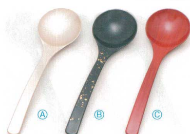
7-874-11 A お玉スプーン (20×5.7) 梱500 A H-60-40 シャンパンゴールド ¥900 B H-60-41 黒色紙金箔 ¥1,250 C H-60-42 朱木目 ¥1,250