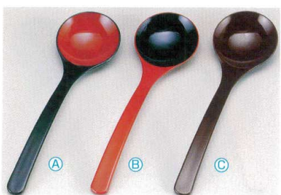
7-874-9 A お玉スプーン (20×5.7) 梱500 A 1-772-26 黒内朱 ¥750 B 1-772-27 朱内黒 ¥750 C H-9-40 新溜 ¥750