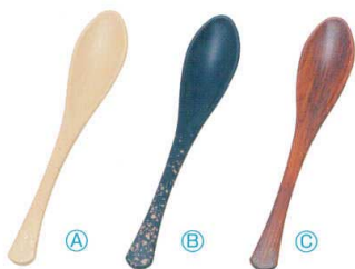
7-874-6 A (小)かゆスプーン (16×2.8) 梱500 A H-60-28 ベージュ金たたき ¥550 B H-60-29 紺金たたき ¥550 C H-60-30 紫檀木目 ¥1,050