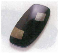
7-890-36 1-765-15 M布袋おしぼり入れ 黒色紙 ¥1,950 (18.6×8.2×1.2) 横200