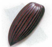
7-890-18 1-655-4 A(小)笹皿 溜 ¥750 (19.5×7×1.2) 横200