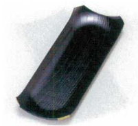
7-890-8 1-764-5 A隅切おしぼり入れ 黒測金 ¥700 (16.8×6.2×1.4) 横200