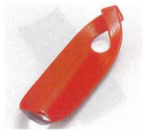
7-890-12 1-764-9 A結びおしぼり入れ 朱 ¥360 (19×5.5×4) 横200