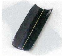
7-890-25 1-765-5 M竹型おしぼり入れ 黒に金ライン ¥980 (17.3×6.1×1.9) 横200