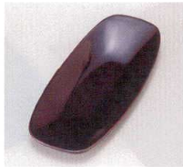
7-890-33 1-765-12 M布袋おしぼり入れ 溜 ¥1,350 (18.6×8.2×1.2) 横200