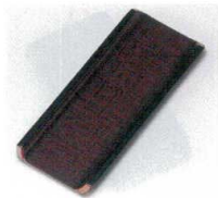
7-890-16 H-9-20 M布目おしぼり入れ 栃布目 ¥1,200 (17.8×7.2×1.3) 横200