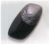
7-890-35 1-765-14 M布袋おしぼり入れ 黒武蔵野 ¥1,850 (18.6×8.2×1.2) 横200