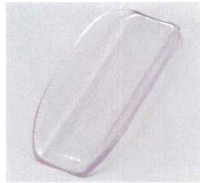
7-890-1 1-764-1 AC富士おしぼり入れ 透明 ¥300 (17×7.3×2.5) 横200