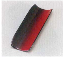
7-890-27 1-765-7 M竹型おしぼり入れ 曙 ¥900 (17.3×6.1×1.9) 横200