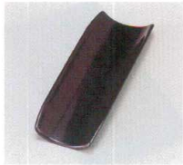
7-890-23 1-765-3 M竹型おしぼり入れ 溜 ¥775 (17.3×6.1×1.9) 横200