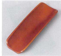
7-890-4 H-68-78 A新富士おしぼり入れ 総春慶塗 ¥1,000 (17.1×5.7×2) 横200