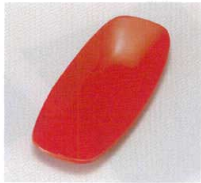
7-890-32 1-765-11 M布袋おしぼり入れ 朱 ¥1,100 (18.6×8.2×1.2) 横200