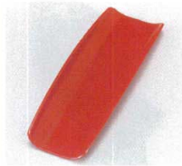
7-890-5 1-764-2 AC胴張おしぼり入れ 朱 ¥340 (17.2×6×1.7) 横200