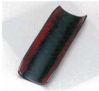
7-890-31 H-1-18 M竹型おしぼり入れ 朱布張 ¥1,600 (17.3×6.1×1.9) 横200