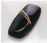
7-890-34 1-765-13 M布袋おしぼり入れ 黒花帯 ¥2,100 (18.6×8.2×1.2) 横200