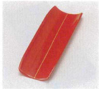
7-890-24 1-765-4 M竹型おしぼり入れ 朱に金ライン ¥960 (17.3×6.1×1.9) 横200