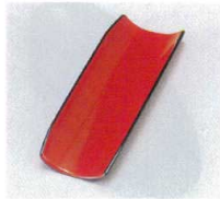
7-890-21 1-765-1 M竹型おしぼり入れ 朱天黒 ¥800 (17.3×6.1×1.9) 横200