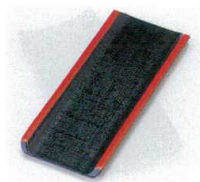
7-890-13 1-764-17 M布目おしぼり入れ 黒天朱 ¥730 (17.8×7.2×1.3) 横200