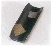
7-890-30 1-765-10 M竹型おしぼり入れ 色紙 ¥1,400 (17.3×6.1×1.9) 横200