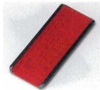
7-890-15 H-9-19 M布目おしぼり入れ 朱かすり布目 ¥1,200 (17.8×7.2×1.3) 横200