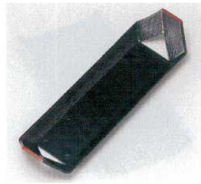
7-890-10 H-9-17 P.S.笹舟おしぼり入れ 黒天朱 ¥330 (18.9×5.5×3.2) 横200