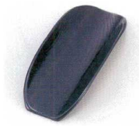
7-890-2 1-764-7 A富士おしぼり入れ 黒 ¥400 (17×7.3×2.5) 横200