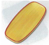
7-890-19 H-9-22 A小判型おしぼり入れ 白木天ウルミ ¥1,050 (17.1×8.1×1.3) 横200