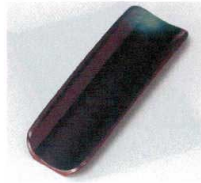
7-890-3 H-8-5 A新富士おしぼり入れ 溜 ¥590 (17.1×5.7×2) 横200