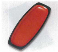
7-890-17 H-9-21 A新胴張おしぼり入れ 朱天黒 ¥980 (19.7×7.8×1.2) 横200