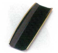
7-890-6 1-764-3 A胴張おしぼり入れ 黒天金 ¥500 (17.2×6×1.7) 横200