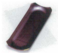
7-890-9 1-764-6 A隅切おしぼり入れ 溜測金 ¥850 (16.8×6.2×1.4) 横200