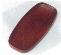
7-890-20 H-9-23 A小判型おしぼり入れ チーク塗 ¥1,300 (17.1×8.1×1.3) 横200