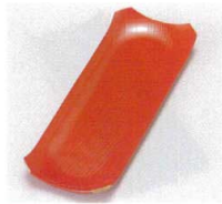
7-890-7 1-764-4 A隅切おしぼり入れ 朱測金 ¥700 (16.8×6.2×1.4) 横200