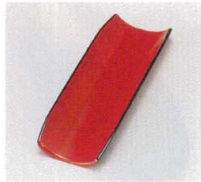
7-890-22 1-765-2 M竹型おしぼり入れ 後藤塗 ¥1,100 (17.3×6.1×1.9) 横200