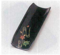
7-890-29 1-765-9 M竹型おしぼり入れ 竜田川 ¥1,400 (17.3×6.1×1.9) 横200