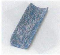
7-890-26 1-765-6 M竹型おしぼり入れ 和紙塗ブルー ¥1,250 (17.3×6.1×1.9) 横200