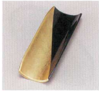
7-890-28 1-765-8 M竹型おしぼり入れ 金箔/黒 ¥1,900 (17.3×6.1×1.9) 横200