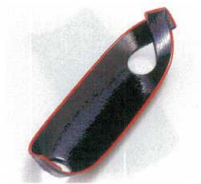
7-890-11 1-764-8 A結びおしぼり入れ 黒天朱 ¥360 (19×5.5×4) 横200