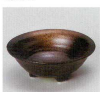
104-21-674 金茶吹三つ足ミニ小鉢 400円 9.8×3.5cm 10421674