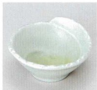
104-15-524 黄吹巻型小付 620円 9.8×4.2cm 11818522