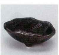
104-24-214 黒結晶布目楕円小付 320円 9.8×6.8×3.7cm 11111213