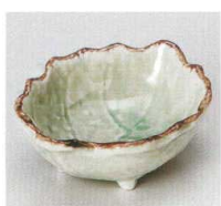
104-33-724 貫入木の葉型小付 260円 9.7×7.8×3.5cm 11128723