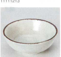
104-30-214 白梨地小付 260円 10×3.7cm 10430214