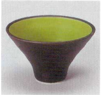
104-12-354 ヒョウ釉高台珍珠 750円 9.7×5.9cm 10410351