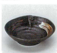
104-19-554 豪快・白翔千代口 450円 9.8×8.6×3.3cm 10419554