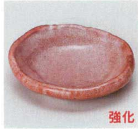
104-7-054 赤染小皿 780円 10×9.5cm 10407054