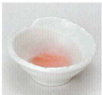
104-16-524 ピンク吹巻型小付 620円 9.8×4.2cm 11817522