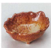
104-31-724 茶木の葉型小付 260円 9.7×7.8×3.5cm 11130723