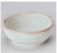
104-18-624 錆ボカシ3.0ボール 460円 9.8×3.9cm 10418624