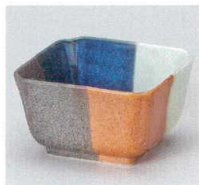
104-13-624 ぬり分角小鉢 750円 9.7×9.7×5.5cm 50入 08917601