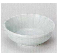
104-34-214 青白丸小付 230円 10×3.8cm 10434214