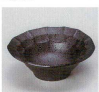
104-22-054 黒石垣ミニ鉢 370円 10×3.5cm 200入 11326051