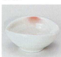
104-20-754 ピンクうずうず小付 420円 10×8.3×4.5cm 11133751