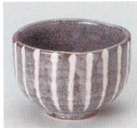
104-1-514 嵐十草小鉢 980円 9.9×6.8cm 10704513