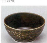
104-26-674 織部石目小鉢 280円 9.7×4.4cm 09330673