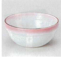
104-8-524 ピンク吹スタック小鉢(小)(241-15)(中国製) 780円 9.8×4cm 5入 10225521