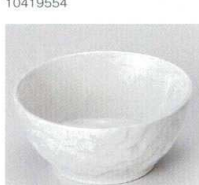
104-25-674 乳白石目小鉢 280円 9.7×4.4cm 11119673