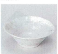
104-23-054 白石垣ミニ鉢 370円 10×3.5cm 200入 11325051