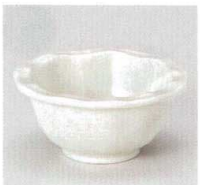
104-17-194 アイボリーリム付小付 500円 9.7×4.5cm 11904192