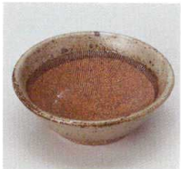
104-6-204 唐津3.2寸すり鉢 950円 9.8×3.5cm 11807202