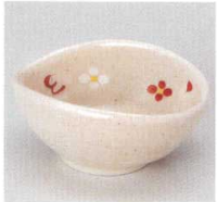
104-5-114 花ちらし玉子小付 930円 9.9×8×4.3cm 10713113