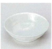
104-35-354 乳白3.0深皿 220円 9.9×2.7cm 11336351