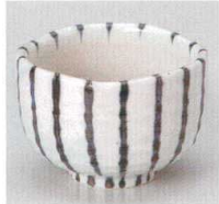
104-3-514 呉須十草小鉢 980円 9.7×6.5cm 10706513