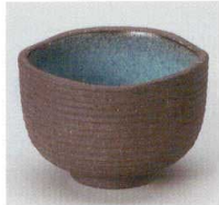
104-2-514 南蛮小鉢 980円 9.9×6.5cm 10705513