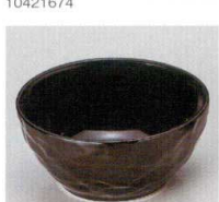
104-27-674 天目石目小鉢 280円 9.7×4.4cm 11122673