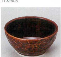
104-28-674 アメ釉石目小鉢 280円 9.7×4.4cm 11121673