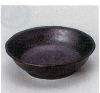
104-36-354 いぶし3.0深皿 220円 9.9×2.7cm 11133353