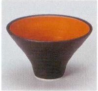
104-11-354 柿釉高台珍珠 750円 9.7×5.9cm 10409351