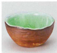
104-14-564 錆グリーンタタラ小鉢 630円 9.8×9.5×5cm 10414564