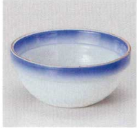
104-10-524 コバルト吹スタック小鉢(小)(241-23)(中国製) 780円 9.8×4cm 5入 10219521