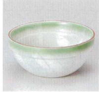
104-9-524 ヒョウ吹スタック小鉢(小)(241-04)(中国製) 780円 9.8×4cm 5入 10222521