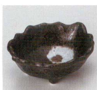
104-32-724 備前木の葉型小付 260円 9.7×7.8×3.5cm 11127723