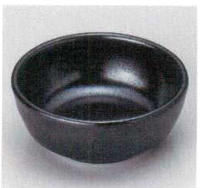
111-30-354 黒釉丸珍珠 420円 8.2×3.3cm 11423353