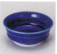
111-36-714 十字丸珍珠(ルリ) 330円 8.2×3cm 11508733