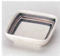
111-16-794 曙(あけぼの)豆干代久 550円 8.2×8.2×2.5cm 54370791