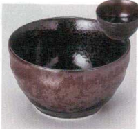
111-37-674 黒水晶深型珍珠 300円 8.3×4.5cm 11137674