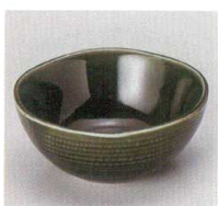
111-40-504 織部なわめ珍珠 230円 8.2×3.5cm 11140504

盛鉢 14P~ 楕円鉢 組鉢 38P~ 刺身 向付 46P~ 中鉢 小鉢 64P~ 小付 珍珠 100P~