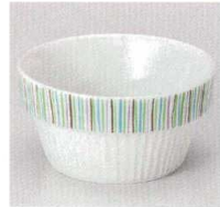
111-2-114 ストライプスタック小付 900円 8.2×4.2cm 11102114