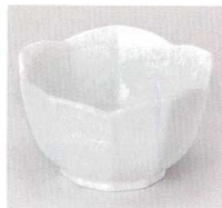
111-25-194 白桔梗小鉢(小) 460円 8.3×4.8cm 150入 11402193