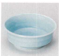
111-33-714 十字丸珍珠(青磁) 330円 8.2×3cm 11316731