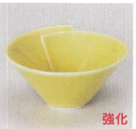
111-29-714 黄ハス小付 440円 8.2×4cm 11415713