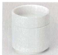
111-19-354 白マットスタック小鉢 510円 8.3×6cm 11234352 111-20-354 白マットスタック 中 400円 8.2×3cm 11235352