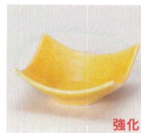
111-13-724 黄角小付 560円 8.3×8.3×3.5cm 10823781