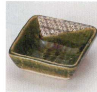
111-3-794 織部菱紋角小付 880円 8.2×8.2×3.1cm 11103794