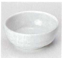
111-26-354 白釉丸珍珠 450円 8.2×3.3cm 11407353