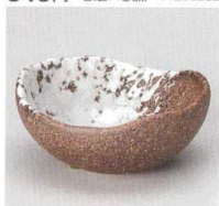
111-18-194 信楽白吹ダ円小付 540円 8.2×7.5×3.7cm 11835192