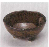
111-39-204 織部結晶三ツ足鉢(小) 260円 8.2×3.8cm 11532203