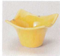
111-8-714 黄釉二彩花小鉢 680円 8.2×8.2×5.8cm 11108714