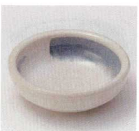
111-32-274 白うのふ刷毛豆皿 330円 10×3.2cm 11132274