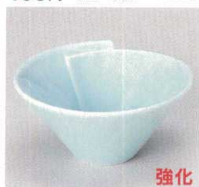
111-27-714 青磁ハス小付 440円 8.2×4cm 11413713