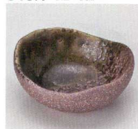
111-17-194 信楽オリベ吹ダ円小付 540円 8.2×7.5×3.7cm 11830192