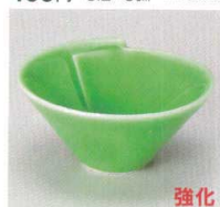
111-28-714 グリーン ハス小付 440円 8.2×4cm 11414713