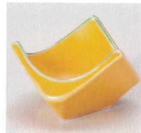
111-4-524 黄釉グリーン三角小付 800円 8.2×4.7cm 11104524