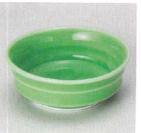
111-35-714 十字丸珍珠(グリーン) 330円 8.2×3cm 11317731