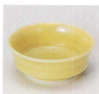
111-34-714 十字丸珍珠(黄) 330円 8.2×3cm 11509733