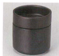
111-21-354 黒マットスタック小鉢 510円 8.3×6cm 11232352 111-22-354 黒マットスタック 中 400円 8.2×3cm 11233352