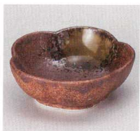
111-31-194 信楽梅型小付 360円 8.3×3.1cm 150入 11505193