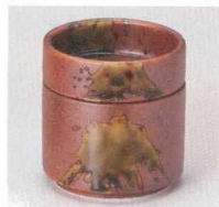
111-11-254 茶織部吹きスタック二段小鉢(浅中) 480円 8.2×3cm 11239252 111-12-254 茶織部吹きスタック二段小鉢(深口) 640円 8.2×6cm 11238252