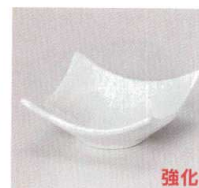
111-14-724 白角小付 560円 8.2×8.2×3.5cm 10821721