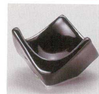
111-6-524 黒釉プラチナ三角小付 800円 8.2×4.7cm 11106524