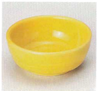
111-24-354 黄釉丸珍珠 490円 8.2×3.3cm 11220351