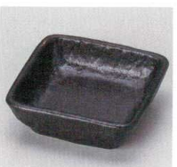
111-38-214 黒釉角小付 280円 8.3×8.3×3cm 11138214