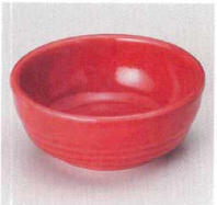
111-23-354 赤釉丸珍珠 490円 8.2×3.3cm 11330353