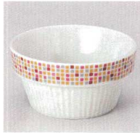
111-1-114 モザイクスタック小付 900円 8.2×4.2cm 11101114