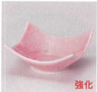
111-15-724 ピンク角小付 560円 8.2×8.2×3.5cm 10822721