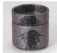
111-9-254 いぶし黒吹きスタック二段小鉢(浅中) 480円 8.2×3cm 11241252 111-10-254 いぶし黒吹きスタック二段小鉢(深口) 640円 8.2×6cm 11240252