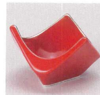
111-5-524 赤釉金線三角小付 800円 8.2×4.7cm 11105524