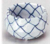
117-8-194 内外網三ツ足珍味小 1,550円 4.8×2.9cm 300入 12201193