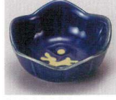
117-26-694 青釉兎花型珍味(南皿) 650円 7.5×3.5cm 10×16入 11128691