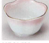
117-36-524 ピンク吹梅形珍味(大)(216-15)(中皿製) 550円 7.5×4.5cm 10入 11111521