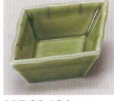
117-30-694 緑釉菱型珍味(有田焼) 650円 9×6.5×3cm 10×16入 11827691