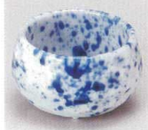
117-9-194 吹墨デコデコ三ツ足珍味小 1,000円 4.8×2.9cm 300入 12203193