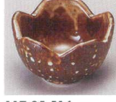
117-35-514 潮騒珍味 530円 6.8×4.2cm 12310513