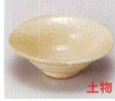
117-20-554 かいらぎ黄釉千代久 730円 8.2×7.8×3cm 11718551