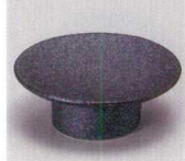
117-11-274 いぶし高台小皿 880円 8.2×3cm 11906271