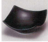
117-17-674 黒マット四方上り豆皿 780円 7.3×7.3×3cm 58118671