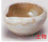
117-16-214 粉引片口珍味 770円 7.5×7×4cm 11629213