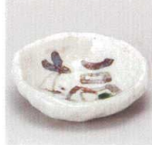
117-4-204 志野福の字豆皿 1,250円 6×1.7cm 52319201