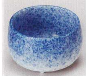
117-43-204 吹墨珍味(大) 500円 5.8×3.8cm 12026201