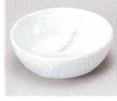
117-22-674 白磁丸千代久 650円 7.2×2.5cm 59728671