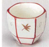
117-5-364 ボンボリ珍味(大) 980円 5.4×4.8cm 12803362