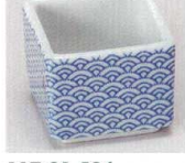
117-31-524 青海波5.5角珍味 600円 5.5×5.5×1.8cm 11731524