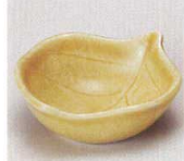
117-47-714 黄瀬戸木の葉豆鉢 270円 8.5×7.7×3cm 12334713