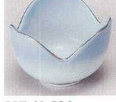
117-41-524 コバルト吹湖金刺山桐珍味(大)(211-23)(中皿製) 480円 6.5×4.5cm 10入 12237521