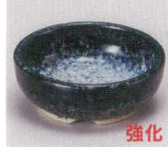
117-14-794 雲海丸千代久 680円 6.8×2.7cm 55418781