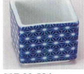
117-32-524 麻の葉(濃紺)5.5角珍味 600円 5.5×5.5×1.8cm 11732524