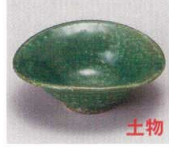
117-19-554 かいらぎ緑釉千代久 730円 8.2×7.8×3cm 11716551