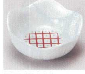
117-27-694 華花型珍味(有田焼) 650円 7.5×3.5cm 10×16入 11112691