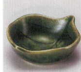
117-48-714 織部木の葉豆鉢 270円 8.5×7.7×3cm 12333713