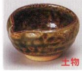
117-15-214 織部片口珍味 770円 7.5×7×4cm 12119213