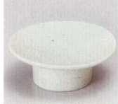
117-10-274 粉引高台小皿 880円 8.2×3cm 29217273