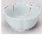
117-24-194 赤筋桔梗型平珍味 640円 6.8×3.3cm 11724191