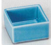
117-45-194 トルコ切立マス型小鉢中 470円 6.5×3.5cm 100入 11421193