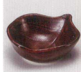
117-49-714 鈴木の葉豆鉢 270円 8.5×7.7×3cm 12335713