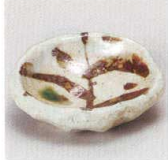
117-3-204 織部草紋豆皿 1,250円 6×1.7cm 52318201