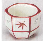
117-6-364 ボンボリ珍味(小) 760円 4×3.3cm 12804362