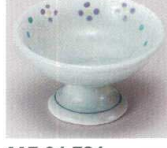
117-34-794 このみ高台珍味 560円 8×4.5cm 11721791