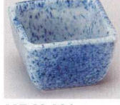
117-38-194 吹墨浜ナシ角珍味 500円 5.9×3.8cm 300入 12237193