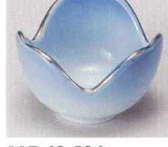
117-42-524 コバルト吹湖金刺山桐珍味(小)(212-23)(中皿製) 380円 5.2×3.3cm 12952522