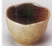
117-46-364 吹き織部花形珍味 340円 6.8×4.5cm 12325363