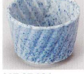
117-37-194 吹墨ネジリ菊型珍味 520円 5.5×4.1cm 300入 12236193