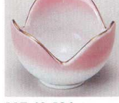
117-40-524 ピンク吹湖金刺山桐珍味(小)(212-15)(中皿製) 380円 5.2×3.3cm 12954522