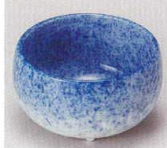
117-44-204 吹墨珍味(小) 470円 4.7×2.4cm 12025201