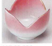
117-39-524 ピンク吹湖金刺山桐珍味(大)(211-15)(中皿製) 480円 6.5×4.5cm 12953522