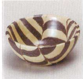
117-1-364 太帯練込珍味 2,250円 6.7×2.8cm 11701364