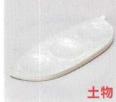
117-13-214 白釉三品盛 650円 15×5.5×0.7cm 11928213