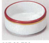
117-33-754 赤金ライン珍味 600円 6.8×3cm 11916751