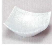
117-18-674 白磁四方上り豆皿 780円 7.3×7.3×3cm 58119671