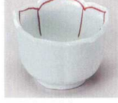
117-25-194 赤筋桔梗型珍味 570円 5.1×3.5cm 300入 12701193