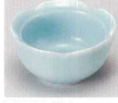
117-28-514 青地輪花珍味 650円 7.4×3.8cm 10213511