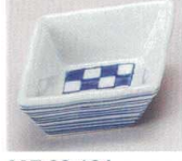
117-29-694 濃市松菱型珍味(南皿) 650円 9×6.5×3cm 10×16入 11829691