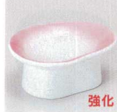
117-7-704 ピンク吹高台珍味 860円 8.7×7×3.6cm 12319702