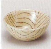
117-2-364 細帯練込珍味 2,250円 6.7×2.8cm 11702364