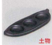
117-12-214 黒釉三品盛 650円 15×5.5×0.7cm 11927213