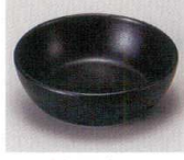
117-23-674 黒マット丸千代久 650円 7.2×2.5cm 59727671