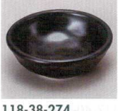
118-38-274 黒結晶タキ珍味 300円 8.6×8.6×2.9cm 11838274