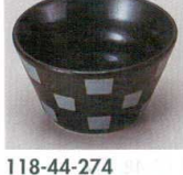
118-44-274 黒四角模様丸珍味 280円 7.3×7.3×4.1cm 11844274