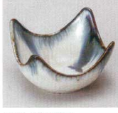
118-23-194 ウノフ四ツ山珍味 380円 3.6×4.2cm 150入 12314193