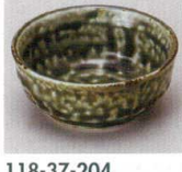
118-37-204 いらぼ織部小付 290円 8×3.8cm 11522203