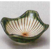
118-5-714 織部十草角珍味 430円 7.1×7.1×2.4cm 200入 12308783