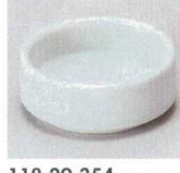
118-29-354 白マットスタックミニ 350円 6.6×2.5cm 12519353