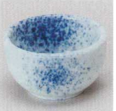
118-11-194 吹ズミ丸小鉢 中 420円 6.8×3.9cm 12549192