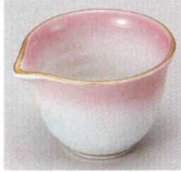
118-16-524 ピンク吹付口形珍味(小) (208-15)(中国製) 380円 6.2×5.5×4cm 20入 11949521