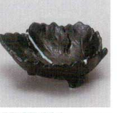
118-27-214 黒一本筋葉型珍味 330円 10×8×3.5cm 12321213