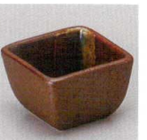
118-6-194 信楽浜ナン角珍味 440円 5.8×4cm 300入 12303193