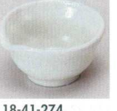
118-41-274 クリーム片口珍味 280円 7.2×6.7×3.5cm 12447273