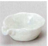
118-4-674 アイボリー片口小付 450円 8×7×2.5cm 12215673