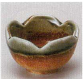
118-3-514 伊賀織部珍味 530円 6.8×4.2cm 12311513