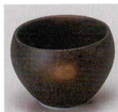
118-1-274 備前なごみ珍味 650円 7×7×5cm 11801274