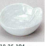
118-35-194 青白鶴珍味 300円 7.8×7.2×2.6cm 200入 12140193