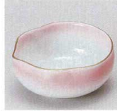
118-15-524 ピンク吹付三型珍味(大) (203-15)(中国製) 400円 5.3×5×2.5cm 12623523