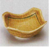
118-18-794 黄瀬戸線角珍味 350円 7.3×7.3×3cm 12323793