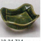
118-34-714 織部ソギ格子角珍味 300円 7.5×7.5×3.4cm 11834714