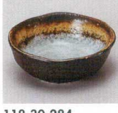
118-30-284 アカネ珍味 340円 8.2×3cm 160入 11830284