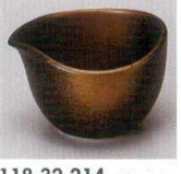
118-32-214 備前風片口珍味 310円 8×7×5.3cm 12223211