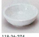
118-36-274 白なしじタキ珍味 300円 8.6×8.6×2.9cm 11836274