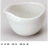
118-31-214 クリーム片口珍味 310円 8×7×5.3cm 12222211