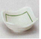
118-19-794 志野線角珍味 350円 7.3×7.3×3cm 12322793