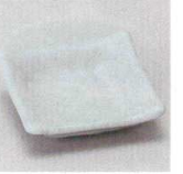
118-21-754 白釉角珍味 350円 6.5×6.5×2cm 11932751