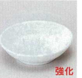
118-13-754 2 3/4吋深皿 400円 7.1×2cm 30119752