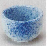
118-12-194 吹ズミ丸小鉢 小 400円 5.6×3.6cm 12550192