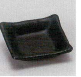
118-20-754 黒釉角珍味 350円 6.5×6.5×2cm 11933751