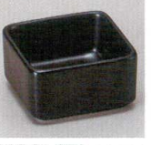
118-26-274 黒結晶角珍味 350円 6.3×6.3×3.3cm 11826274