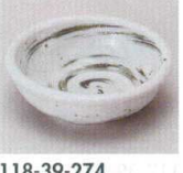
118-39-274 ねずみ渦丸小付 280円 8.5×8.5×2.8cm 11839274