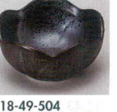
118-49-504 天目梅型珍味小鉢 180円 6.5×3.5cm 11849504