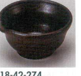
118-42-274 栗茶片口珍味 280円 7.2×6.7×3.5cm 12418272