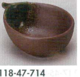
118-47-714 南蛮ナス型珍味 240円 8.8×6.5×3cm 11940711