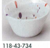
118-43-734 ピンク二色吹小付 280円 7.3×4.1cm 11436733