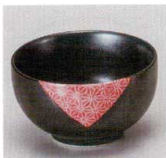
118-2-194 黒マットピンク麻の葉丸小付 580円 7.1×4.1cm 11132191