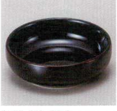
118-24-194 天目2.5鉄鉢 380円 8.6×2.7cm 200入 27443191