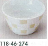
118-46-274 白四角模様丸珍味 280円 7.3×7.3×4.1cm 11846274