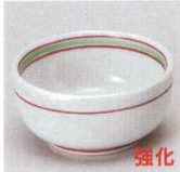
118-9-754 グリーン巻珍味 420円 6.8×3.5cm 11925751