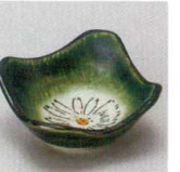
118-14-714 織部菊角珍味 400円 7.5×7.5×3.3cm 11928711