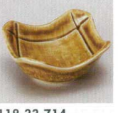
118-33-714 黄瀬戸ソギ格子角珍味 300円 7.5×7.5×3.4cm 11833714