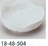
118-48-504 粉引梅珍味平鉢 190円 7.6×2.7cm 11848504