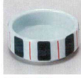
118-22-284 赤一珍兵衛十草スタック珍味 380円 6.6×2.5cm 160入 11822284