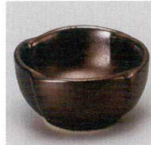
118-8-734 金彩四ツ切珍味 430円 7×3.5cm 11542731