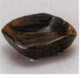
118-25-214 備前風角千代久 360円 8.3×7.5×3cm 27624211