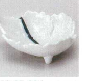
118-28-214 白一本筋葉型珍味 330円 10×8×3.5cm 12320213