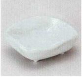
118-17-214 白粉引角千代久 360円 8.3×7.5×3cm 27625211