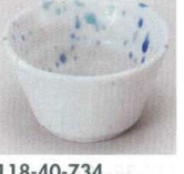
118-40-734 ブルー二色吹小付 280円 7.3×4.1cm 11435733