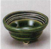
118-10-714 ライン織部三ツ足珍味 430円 7.5×3.5cm 11810714