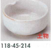
118-45-214 白志野片押珍味 240円 7.4×7×3.8cm 11110213