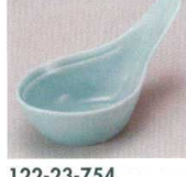
122-23-754 小籠包レンゲ 珍味 青磁 430円 12×6×5cm 12223754