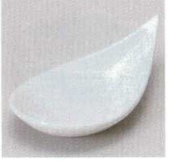
122-12-114 ナナミ白珍味(中国製) 400円 11.5×6.7×3cm 12912113