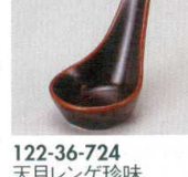
122-36-724 天目レンゲ珍味 390円 6×4.9×7cm 12016721