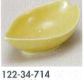
122-34-714 桜型小鉢イエロー 400円 11.4×7×3.7cm 12234714