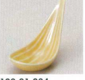
122-21-204 笹アミューズイエロー 480円 10.5×4.5×7.4cm 12817202