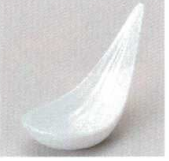
122-14-754 笹アミューズ白磁 480円 4.4×10.5cm 12819752