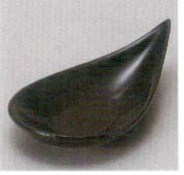
122-13-114 ナナミ黒珍味(中国製) 420円 11.5×6.7×3cm 12914113