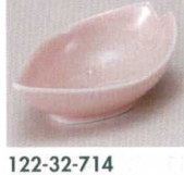
122-32-714 桜型小鉢ピンク 400円 11.4×7×3.7cm 12232714