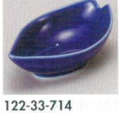
122-33-714 桜型小鉢ルリ 400円 11.4×7×3.7cm 12233714