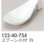
122-40-754 スプーン小付 白 370円 11.5×4.2×3.3cm 12024751