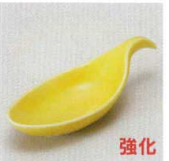
122-6-554 黄スプーン型小付 610円 12×4.8×3cm 300入 12007551