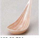
122-20-754 笹アミューズピンク 480円 4.4×10.5cm 12818752