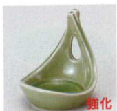
122-1-054 天竜青磁手付珍味入 900円 6.3×6.5×7.3cm 12901053