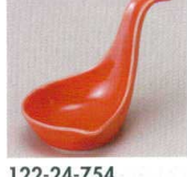
122-24-754 レンゲ型珍味 赤 400円 10.5×6.4×7.3cm 11550751