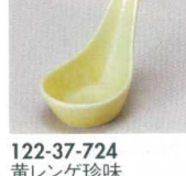
122-37-724 黄レンゲ珍味 390円 6×4.9×7cm 12013721