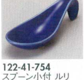
122-41-754 スプーン小付 ルリ 370円 11.5×4.2×3.3cm 12021751