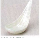
122-19-754 笹アミューズ(ヒフ) 珍味 460円 10.5×4.4cm 12940753