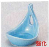
122-2-054 トルコ手付珍味入 900円 6.3×6.5×7.3cm 12903053