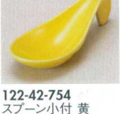
122-42-754 スプーン小付 黄 370円 11.5×4.2×3.3cm 12022751