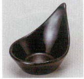
122-10-114 タチミ黒珍味(中国製) 420円 9.7×7×6cm 12909113