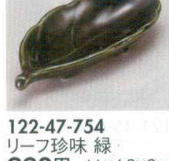
122-47-754 リーフ 珍味 緑 260円 11×4.8×2cm 12247754