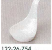
122-26-754 レンゲ型珍味 白 400円 10.5×6.4×7.3cm 11552751