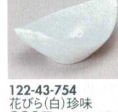
122-43-754 花びら(白) 珍味 320円 9.5×6×3.5cm 12935753