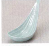
122-17-754 笹アミューズ(青磁) 珍味 460円 10.5×4.4cm 12941753