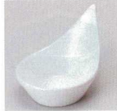
122-8-114 タチミ白珍味(中国製) 400円 9.7×7×6cm 12910113

盛鉢 14P~ 楕円鉢 組鉢 38P~ 刺身 向付 46P~ 中鉢 小鉢 64P~