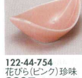
122-44-754 花びら(ピンク) 珍味 320円 9.5×6×3.5cm 12927753