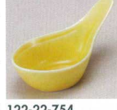
122-22-754 小籠包レンゲ 珍味 黄 430円 12×6×5cm 12222754