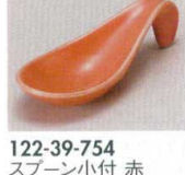
122-39-754 スプーン小付 赤 370円 11.5×4.2×3.3cm 12023751