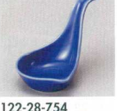
122-28-754 レンゲ型珍味 青 400円 10.5×6.4×7.3cm 11551751