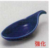
122-7-554 ルリスプーン型小付 610円 12×4.8×3cm 300入 12008551

盛鉢 14P~ 楕円鉢 組鉢 38P~ 刺身 向付 46P~ 中鉢 小鉢 64P~