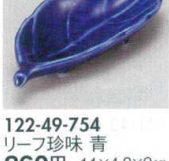
122-49-754 リーフ 珍味 青 260円 11×4.8×2cm 12249754