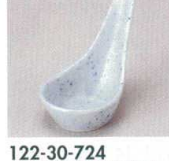
122-30-724 ルリ化粧レンゲ珍味 390円 6×4.9×7cm 12015721