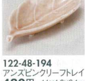
122-48-194 アンズピンクリーフトレイ 480円 11×4.8×2cm 11926191