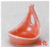
122-3-054 桃袖手付珍味入 900円 6.3×6.5×7.3cm 12902053