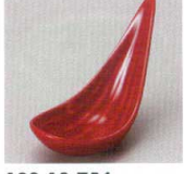
122-18-754 笹アミューズ(真紅) 珍味 480円 10.5×4.4cm 12939753