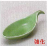
122-5-554 ヒフスプーン型小付 610円 12×4.8×3cm 300入 12005551