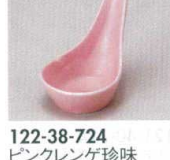
122-38-724 ピンクレンゲ珍味 390円 6×4.9×7cm 12014721