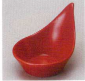
122-9-114 タチミ赤珍味(中国製) 440円 9.7×7×6cm 12911113