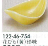
122-46-754 花びら(黄) 珍味 320円 9.5×6×3.5cm 12928753