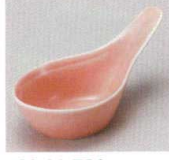
122-16-754 小籠包レンゲ 珍味 ピンク 430円 12×6×5cm 12216754