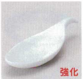
122-4-554 青白磁スプーン型小付 610円 12×4.8×3cm 300入 12006551