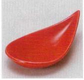
122-11-114 ナナミ赤珍味(中国製) 440円 11.5×6.7×3cm 12913113