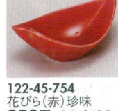
122-45-754 花びら(赤) 珍味 350円 9.5×6×3.5cm 12934753