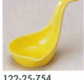
122-25-754 レンゲ型珍味 黄 400円 10.5×6.4×7.3cm 11548751