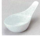
122-15-754 小籠包レンゲ 珍味 白 430円 12×6×5cm 12215754