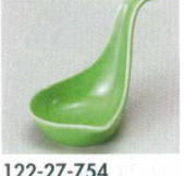
122-27-754 レンゲ型珍味 緑 400円 10.5×6.4×7.3cm 11549751