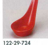
122-29-724 赤レンゲ珍味 420円 6×4.9×7cm 12933723