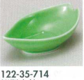
122-35-714 桜型小鉢ヒワ 400円 11.4×7×3.7cm 12235714