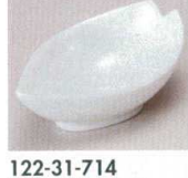
122-31-714 桜型小鉢ホワイト 400円 11.4×7×3.7cm 12231714