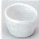
124-20-254 白マット丸珍味 430円 5.2×4.9×3.2cm 12306253