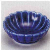
124-48-714 ルリ菊豆珍味 240円 6.1×2.2cm 12042711