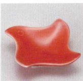
124-2-694 バード(赤)パターンレスト(有田焼) 720円 5.5×5.5×2cm 5入 12402694