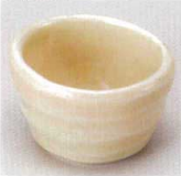
124-16-254 アイボリー変形丸珍味 430円 5.2×4.9×3.2cm 12634253