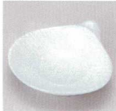
124-43-754 貝がら珍味 白 240円 7.5×7×2.2cm 12443754