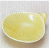
124-45-754 貝がら珍味 黄 240円 7.5×7×2.2cm 12445754