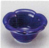
124-39-194 ルリ朝顔珍味 280円 6.9×3.2cm 300入 12441193