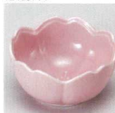
124-42-504 カラミニ小付 ピンク(サクラ) 180円 6.5×3.5cm 12845503