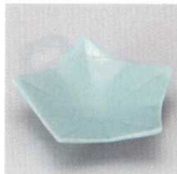
124-11-694 ブーケ(青緑)パターンレスト(有田焼) 720円 6.5×6.5×2cm 5入 12411694