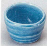
124-17-254 トルコ変形丸珍味 430円 5.2×4.9×3.2cm 12759252