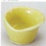
124-25-254 黄反珍味 430円 5.5×4.8×3.2cm 12817253