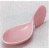
124-30-214 ピンククrostレー 280円 10.5×3.8×3.2cm 12653212