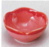
124-36-754 梅珍味 350円 6.6×3.1cm 12436754