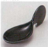
124-32-214 ブラッククrostレー 280円 10.5×3.8×3.2cm 12655212