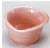
124-22-254 ピンク反珍味 430円 5.5×4.8×3.2cm 12819253