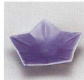
124-8-694 ブーケ(紫)パターンレスト(有田焼) 720円 6.5×6.5×2cm 5入 12408694