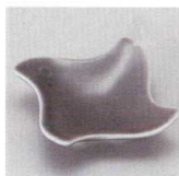
124-4-694 バード(灰)パターンレスト(有田焼) 720円 5.5×5.5×2cm 5入 12404694