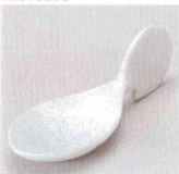
124-31-214 白クrostレー 240円 10.5×3.8×3.2cm 12656212