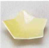
124-9-694 ブーケ(黄)パターンレスト(有田焼) 720円 6.5×6.5×2cm 5入 12409694