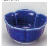
124-35-714 桔梗珍味 ルリ 240円 6.5×3.3cm 12435714