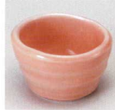
124-15-254 ピンク変形丸珍味 430円 5.2×4.9×3.2cm 12758252