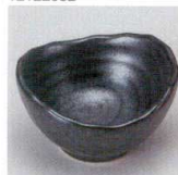
124-13-714 黒木目珍味 330円 5.9×5.6×3.2cm 12831713