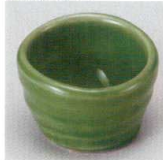
124-19-254 グリーン変形丸珍味 430円 5.2×4.9×3.2cm 12757252