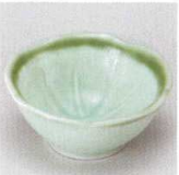
124-37-754 朝顔珍味 350円 7.1×3cm 12437754