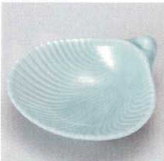
124-46-754 貝がら珍味 青磁 240円 7.5×7×2.2cm 12446754