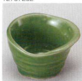
124-26-254 グリーン反珍味 430円 5.5×4.8×3.2cm 12821253