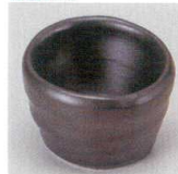
124-21-254 黒マット丸珍味 430円 5.2×4.9×3.2cm 12307253