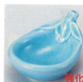
124-6-054 トルコナス型珍味入 750円 7×5×3cm 12122052