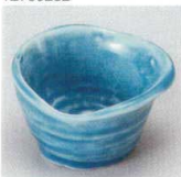
124-24-254 トルコ反珍味 430円 5.5×4.8×3.2cm 12818253