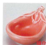
124-7-054 ピンクナス型珍味入 750円 7×5×3cm 12123052