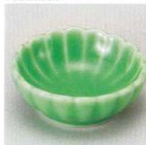
124-49-714 グリーン菊豆珍味 240円 6.1×2.2cm 12044711