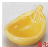
124-5-054 黄釉ナス型珍味入 750円 7×5×3cm 12121052