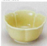
124-33-714 桔梗珍味黄 240円 6.5×3.3cm 12433714