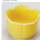
124-28-194 黄桔梗型珍味 340円 5×3.5cm 12315191