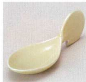
124-29-214 イエロークrostレー 280円 10.5×3.8×3.2cm 12654212