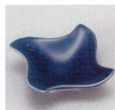
124-1-694 バード(紺)パターンレスト(有田焼) 720円 5.5×5.5×2cm 5入 12401694