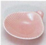
124-47-754 貝がら珍味 ピンク 240円 7.5×7×2.2cm 12447754