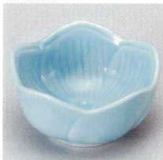
124-40-504 カラミニ小付 ブルー(桔梗) 180円 6.5×3.5cm 12847503