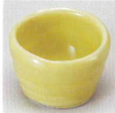
124-18-254 黄変形丸珍味 430円 5.2×4.9×3.2cm 12760252