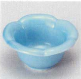
124-38-194 トルコ朝顔珍味 280円 7×3.1cm 12235191