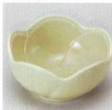
124-41-504 カラミニ小付 黄(梅) 180円 6.5×3.5cm 12846503