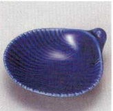
124-44-194 ルリ貝がら珍味 280円 7.5×7.1×2.5cm 12444194