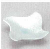
124-3-694 バード(青白)パターンレスト(有田焼) 720円 5.5×5.5×2cm 5入 12403694