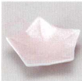
124-10-694 ブーケ(ピンク)パターンレスト(有田焼) 720円 6.5×6.5×2cm 5入 12410694