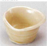
124-23-254 アイボリー反珍味 430円 5.5×4.8×3.2cm 12820253