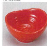
124-14-714 赤木目珍味 330円 5.9×5.6×3.2cm 12829713