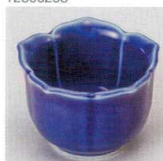
124-27-194 ルリ桔梗型珍味 340円 5×3.5cm 12316191