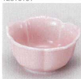
124-34-714 ルリ桔梗珍味 ピンク 240円 6.5×3.3cm 12434714