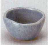
126-10-204 ブルー珍珠(小) 580円 4.5×2.5cm 12602203