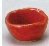
126-8-204 ピンク珍珠(小) 580円 4.5×2.5cm 12601203

盛鉢 14P~ 楕円鉢 組鉢 38P~ 刺身 向付 46P~ 中鉢 小鉢 64P~