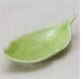
126-12-524 ヒワ木の葉珍珠 400円 9×4×2.2cm 12612524