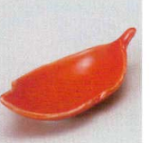
126-13-204 赤木の葉珍珠 410円 9×4×2.2cm 12110201