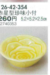
126-49-754 イエローバラ珍珠 200円 6.3×2.2cm 12842753