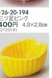
126-27-754 花びらイエロー珍珠 270円 5.8×4.2×3cm 12153751