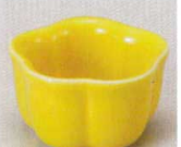
126-18-204 黄柚梅型珍珠(小) 430円 5×2.8cm 12617203