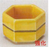
126-5-704 黄六角珍珠 680円 5×3cm 11430781