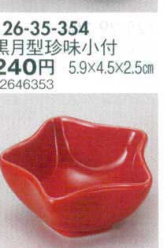
126-42-354 赤星型珍珠小付 260円 5.2×5.2×2.5cm 12740353