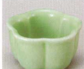
126-16-204 ヒワ梅型珍珠(小) 430円 5×2.8cm 12615203