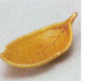
126-14-204 茶木の葉珍珠 410円 9×4×2.2cm 12111201