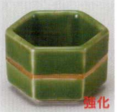
126-4-704 グリーン六角珍珠 680円 5×3cm 11434781