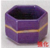
126-2-704 紫六角珍珠 680円 5×3cm 11433781