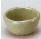
126-9-204 グリーン珍珠(小) 580円 4.5×2.5cm 12603203