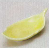
126-11-524 黄柚木の葉珍珠 400円 9×4×2.2cm 12611524