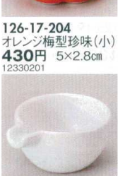
126-24-754 白片ロミニ 360円 7×5.5×3.3cm 11744751