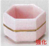
126-3-704 ピンク六角珍珠 680円 5×3cm 11432781