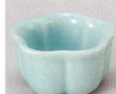
126-15-204 青磁梅型珍珠(小) 430円 5×2.8cm 12331201