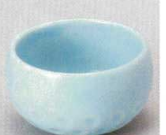
126-19-194 ブルーミツ足珍珠小 400円 4.8×3.2cm 300入 12721193