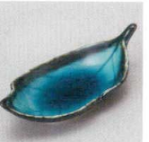
126-7-204 青木の葉珍珠 410円 9×4×2.2cm 12108201

盛鉢 14P~ 楕円鉢 組鉢 38P~ 刺身 向付 46P~ 中鉢 小鉢 64P~