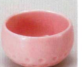
126-20-194 ミツ足ピンク 400円 4.8×2.8cm 12123191