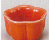
126-17-204 オレンジ梅型珍珠(小) 430円 5×2.8cm 12330201