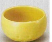
126-21-194 ミツ足黄 400円 4.8×2.8cm 12122191

突出皿 焼物皿 142P~ 仕切皿 のり皿 串焼皿 161P~ 盛皿 166P~ 角皿 (正方形) 174P~