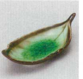
126-6-204 ビードロ葉型珍珠 410円 9×4×2.2cm 12109201