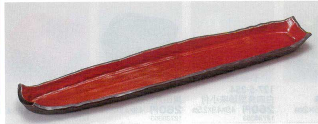
盛鉢 14P~ 128-1-204 ジャパネスク64cm長皿 17,550円 64×15×3.5cm 13001203