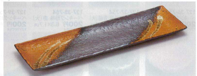
128-11-814 南蛮一珍角ロング皿(萬古焼) 3,500円 49.5×15×3cm 13010813