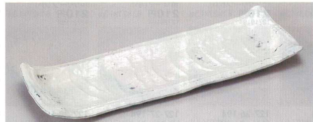
精円皿 206P~ 128-5-524 粉引彫刻長角大皿 6,400円 46×15.5×3.8cm 13102523