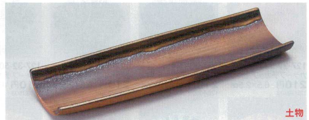
128-8-814 金彩50cm長皿(萬古焼) 4,750円 50×12.5×3.3cm 19210811