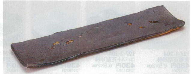
128-2-504 錆長皿 15,000円 54×14×3.3cm 12802504