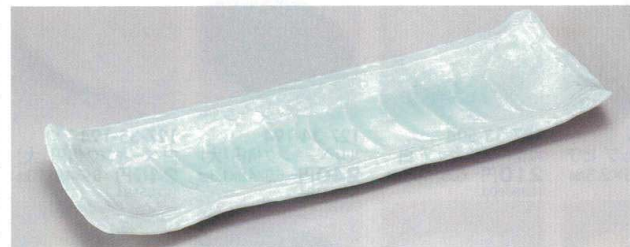
組皿 (大) 270P~ 128-7-524 青白磁波彫長角大皿 6,000円 46×15.5×3.8cm 13103523