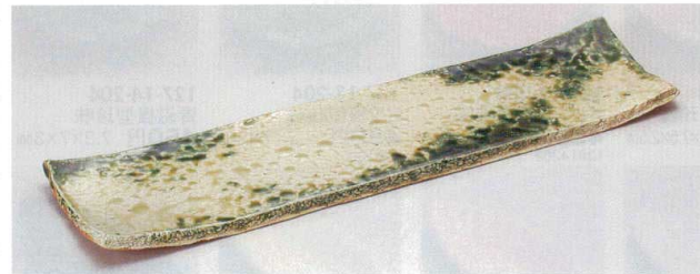
細長皿 128P~ 128-3-504 織部長皿 15,000円 54×14×3.3cm 12803504