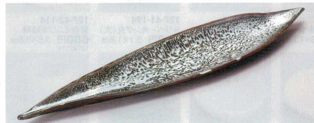
128-10-554 白柚子天目47cmリーフ皿 3,700円 49×11.3×3cm 12810554