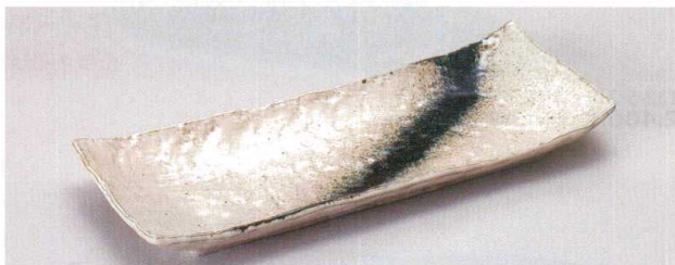
131-7-184 銀河石目11.0長角深皿 2,700円 35×14×4.5cm 19804181