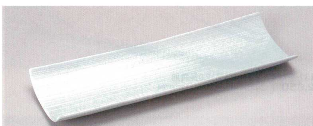
131-3-624 青磁長皿(小) 3,650円 34.5×12×3.3cm 13407623