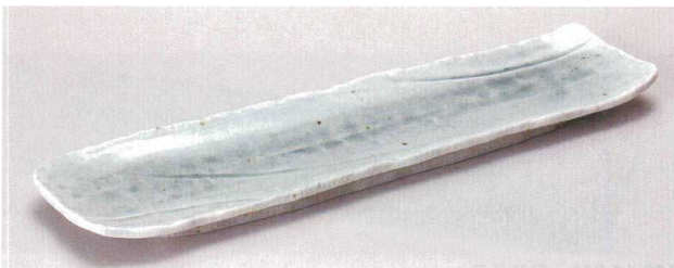
131-10-534 湖畔荒瀬型長皿 1,480円 36×9.5×2.8cm 22404532