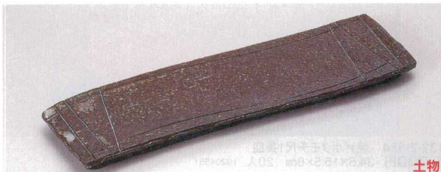
131-1-754 手作り黒波型突出皿 6,160円 36×10.5×1.5cm 22501751