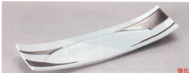
131-2-254 白磁プラチナ12.0寸長角四方皿 4,600円 36×10.5×4cm 19802251