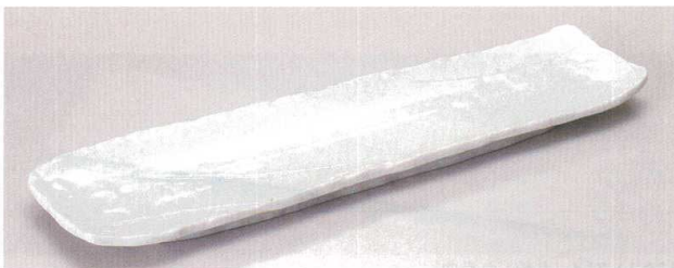
131-11-524 薄氷長皿 1,450円 36×9.5×2.5cm 22407522