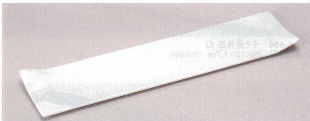
131-5-554 白磁両隅上り36cm細長皿 3,300円 36×9×1.8cm 13105554 131-6-554 白磁両隅上り32cm細長皿 2,700円 32×9×1.8cm 13106554