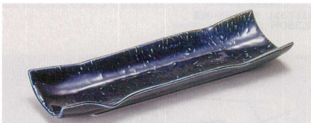
131-9-554 ルリ紺付出皿 1,900円 28.5×9.5×3.4cm 13109554