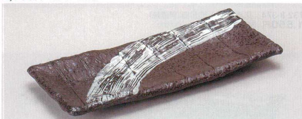
131-8-554 炭化土白刷毛目長角皿 2,590円 31.5×13.3×2.8cm 30入 19808551