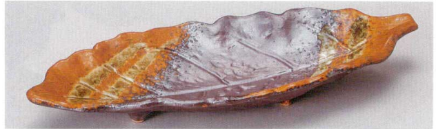
134-4-814 南蛮一珍10.0木ノ葉皿(萬古焼) 1,450円 33.5×14.5×4.3cm 13404814