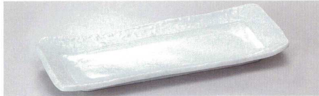
134-3-504 彫刻白釉焼物皿 1,600円 33.5×14.5×3.5cm 13403504