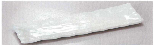
134-9-724 クリーム波瀾長角皿 950円 33.4×10.2×2.2cm 13707723