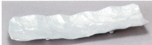
134-6-674 粉引手折さんま皿 1,350円 32.7×10.7×3cm 13609673