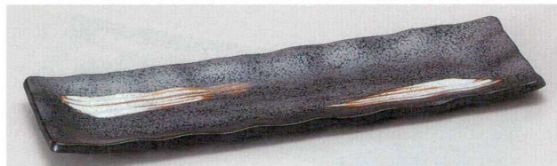
134-8-724 黒結晶刷毛目波瀾長角皿 950円 33.4×10.2×2.2cm 13706723