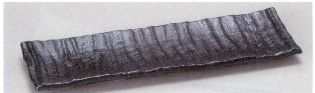
134-11-524 いぶし黒新長皿 930円 32.8×10.5×2.7cm 20104521