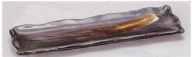
134-13-554 匠 鉄黒白刷毛削り長皿 650円 33×10.7×2.5cm 13712553