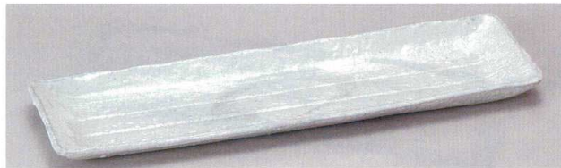
134-12-504 アジアン粉引突出皿 大 670円 33×10.5×2.2cm 13711503