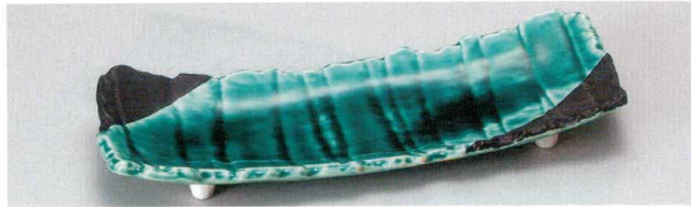
134-1-214 グリーン釉長角皿 3,500円 33×13.5×3.8cm 19604211