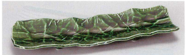
134-7-674 織部手折さんま皿 1,350円 32.7×10.7×3cm 19908671