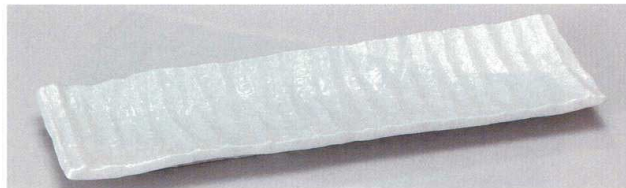
134-10-524 白マット新長皿 930円 33.1×10.5×2.5cm 13710523