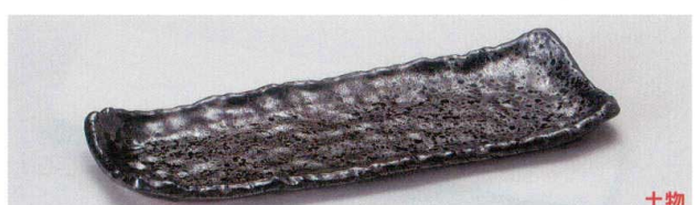
136-10-804 油滴天目変形さんま皿(萬古焼) 1,200円 31.5×12.5×3.5cm 13610804