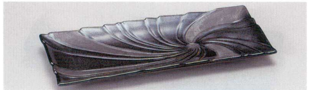
136-6-554 銀彩風車サンマ皿 1,700円 32.5×15.3×2.8cm 13606554

盛皿 166P~ 角皿 (鉢鉢鉢) 174P~ 楕円皿 206P~ 丸皿 212P~ 和皿 前菜皿 7ル~9ル 235P~