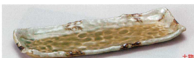
136-9-814 砂ビードロさんま皿(萬古焼) 1,250円 31.5×12.5×3.5cm 20015811

組小皿 小皿 252P~ 有田焼大皿 萬古焼大皿 264P~ 組皿 (大) 270P~