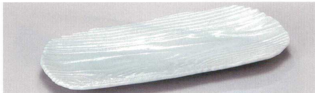
136-7-054 青白磁・屋久島焼物皿 1,650円 30.5×14.5×2.3cm 16907053

盛皿 166P~ 角皿 (鉢鉢鉢) 174P~ 楕円皿 206P~ 丸皿 212P~ 和皿 前菜皿 7ル~9ル 235P~