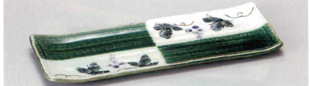
136-12-704 織部市松ぶどう長角皿 1,100円 30×11.5×2cm 13905703