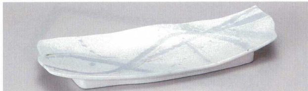
136-5-214 白マット呉須散し長角皿 1,750円 30.8×12.5×3cm 21012211

細長皿 128P~ 突出皿 焼物皿 142P~ 仕切皿 のり皿 串焼皿 161P~