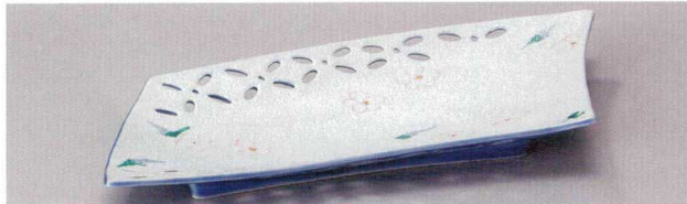
136-3-564 透し花舞前菜皿 2,900円 30×15×3.2cm 13503563

盛鉢 14P~ 楕円鉢 組鉢 38P~ 刺身 向付 46P~ 中鉢 小鉢 64P~ 小付 珍珠 100P~