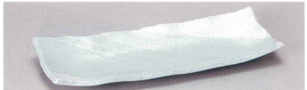
136-8-554 青磁サンマ皿 1,380円 30×12.2×3.2cm 22411552

組小皿 小皿 252P~ 有田焼大皿 萬古焼大皿 264P~ 組皿 (大) 270P~