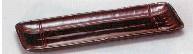
136-11-714 飴ソギ格子サンマ皿 1,150円 31×11×2cm 13611714