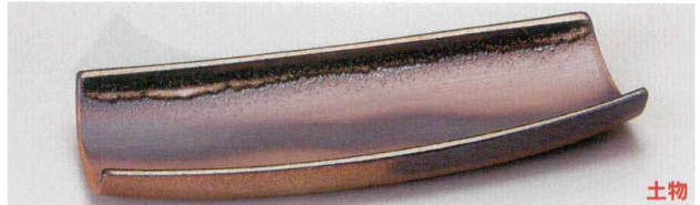
136-4-814 金彩30cm長皿(萬古焼) 2,850円 30×13×3cm 13807813