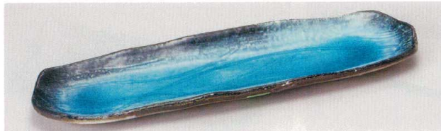
137-6-284 スカイ節目長皿 950円 33.5×10×2.5cm 30入 13706284