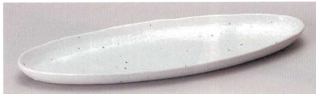
137-10-354 白粉引焼物トレー 680円 32×11×2.3cm 23221352