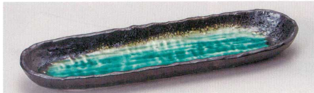
137-8-354 深海トレー 860円 30.3×9.7×3cm 13906354