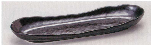
137-12-534 黒釉舟型長皿 620円 33.7×10.5×4cm 23914531