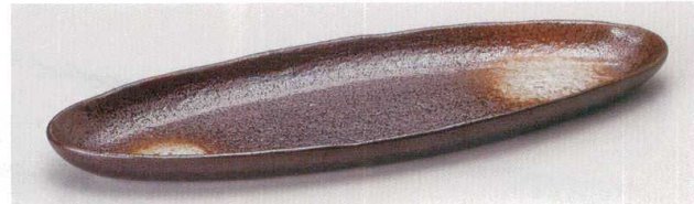
137-11-354 黒水晶焼物トレー 680円 32×11×2.3cm 13912353