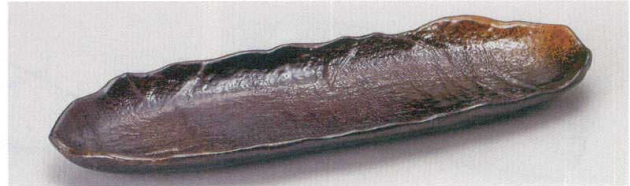
137-5-814 琥珀10.0細舟形皿(萬古焼) 1,000円 30.5×10.3×2.5cm 57174812