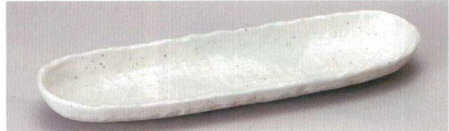
137-7-354 結晶マットトレー 880円 30.4×9.7×3.2cm 13908353