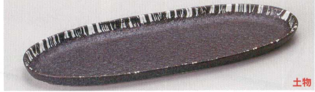
137-3-034 黒マット十草長皿 1,600円 32×12×1.8cm 13703034