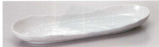
137-13-534 白釉舟型長皿 620円 33.7×11×4cm 23915531