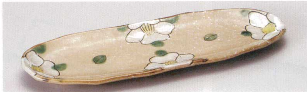
137-4-364 織部椿長皿 1,400円 31.5×11×2.5cm 13704364