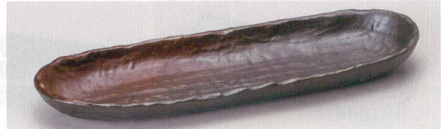
137-9-354 黒備前風トレー 880円 30.4×9.7×3.2cm 13907353