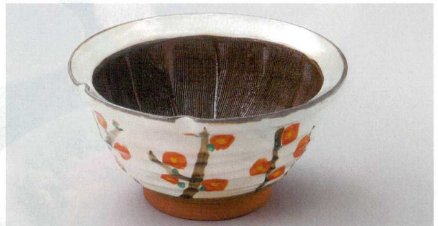
14-6-554 錦梅9.0スリ鉢 14,000円 27.2×14.2cm 01201552