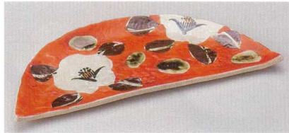
144-2-794 赤濃山茶花半月突出皿 2,820円 27.5×10.8×1.8cm 26609792