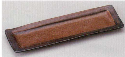
144-8-714 鮎突出皿 1,300円 28×8.8×1.8cm 27008712