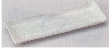
144-18-504 アジアン粉引軸突出皿 480円 26×8.7×1.8cm 14718503