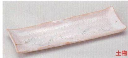
144-4-214 ピンク志野突出皿 1,800円 26.5×8.8×1.8cm 26710212

盛鉢 14P~ 楕円鉢 組鉢 38P~ 刺身 向付 46P~ 中鉢 小鉢 64P~ 小付 珍味 100P~