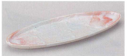
144-12-624 桜志野舟型突出皿 1,160円 25.6×7.9×1.8cm 22918621

細小皿 小皿 252P~ 有田焼大皿 萬古焼大皿 264P~ 組皿 (大) 270P~ 天皿 香水 取鉢 280P~