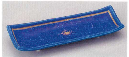
144-3-714 青翠蟹突出皿 2,050円 25.5×8.8×3.5cm 22705711

盛鉢 14P~ 楕円鉢 組鉢 38P~ 刺身 向付 46P~ 中鉢 小鉢 64P~ 小付 珍味 100P~