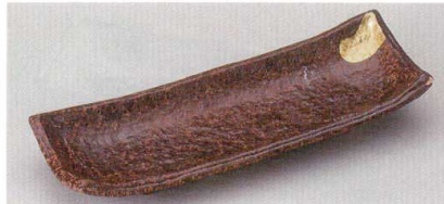
144-5-714 南蛮金彩突出皿 1,650円 25.5×8.8×3.5cm 22808711