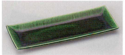
144-9-364 織部長角8.5寸皿 1,200円 26×9×2.4cm 27010362

盛皿 166P~ 角皿 (正味鉢形) 174P~ 楕円皿 206P~ 丸皿 212P~ 和皿 前菜皿 丸/楕形 235P~