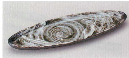
144-10-624 白刷毛舟型付皿 1,200円 25.6×7.9×1.8cm 14410624

盛皿 166P~ 角皿 (正味鉢形) 174P~ 楕円皿 206P~ 丸皿 212P~ 和皿 前菜皿 丸/楕形 235P~