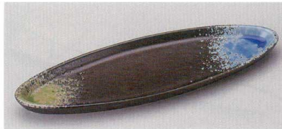
144-11-624 しぶき舟型突出皿 1,190円 25.6×7.9×1.8cm 22917621