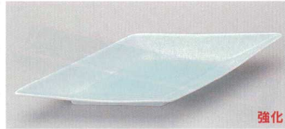
144-7-794 青白磁菱型前菜皿 1,430円 29.5×11.5×3.5cm 14417793

細長皿 128P~ 突出皿 焼物皿 142P~ 仕切皿 のり皿 串焼皿 161P~