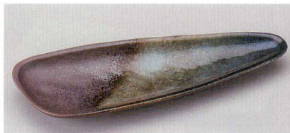
144-14-514 森の湖突出皿 1,000円 26.3×9.4×2.6cm 23109511