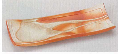
144-16-524 緋ダスキ流し付皿 750円 24.7×9×2.7cm 27301522