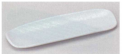
144-15-354 粉引長皿小 860円 24.4×7.5×1.6cm 22619351