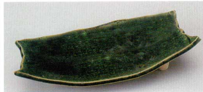
144-1-204 織部ちぎり焼物皿 3,700円 25×11×4.8cm 14801203