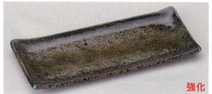
144-6-714 黒緑彩鮎皿 1,550円 25×10.5×2cm 50入 14307783

細長皿 128P~ 突出皿 焼物皿 142P~ 仕切皿 のり皿 串焼皿 161P~