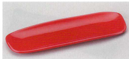
144-13-354 レッド長皿小 1,080円 24.4×7.5×1.6cm 22616351

細小皿 小皿 252P~ 有田焼大皿 萬古焼大皿 264P~ 組皿 (大) 270P~ 天皿 香水 取鉢 280P~