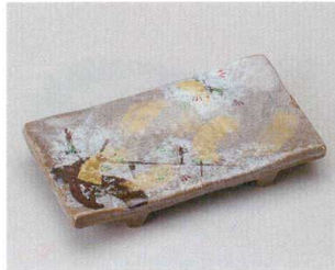
152-2-204 乾山春秋焼物皿 2,750円 21×12×2.8cm 20707201