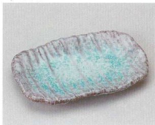
152-13-814 青釉6号波形長角皿(萬古焼) 860円 21×13.5×3cm 26106813