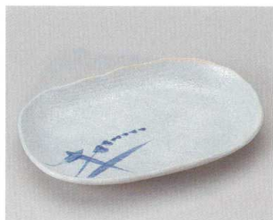
152-15-624 粉引稲穂7.0小判皿 780円 21.1×13.7×2.6cm 24311622