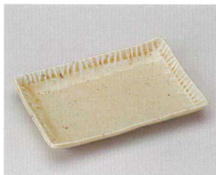
152-14-694 オレンジ瀏十草焼物皿 900円 21×14×2.5cm 5×12入 25919693