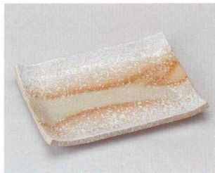
152-7-724 白伊賀焼物皿 1,670円 21.3×15.4×2.7cm 21113721