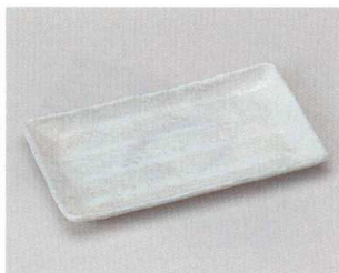
152-23-504 アジアン粉引焼物皿 500円 21×11.7×1.8cm 25918503