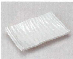
152-19-524 白マット焼物皿 650円 20.9×13.1×2.5cm 25915523