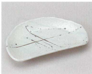
152-17-514 黒筆流半月皿 690円 21×13.2×2.5cm 15217514