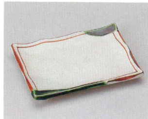
152-5-724 瀏織部8.0焼物皿 1,710円 21×14.5×2.8cm 21114721 152-6-724 瀏織部6.0焼物皿 810円 18×11.2×2cm 26230721