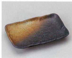
152-11-374 黒備前吹き焼物皿 950円 21.3×14×3cm 25316372