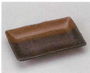
152-18-724 めり分け7.0焼物皿(浜有) 650円 21.1×13.5×2.9cm 15218724