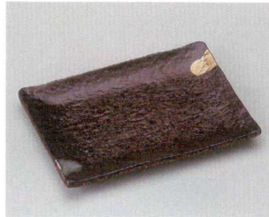
152-3-794 南蛮金銀8.0焼物皿 1,780円 20.8×14.5×2cm 21107791 152-4-794 南蛮金銀7.0長角皿 1,350円 20.2×13×1.8cm 21106791