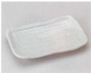
152-20-674 白釉ソギ7.0焼物皿 530円 21×13×2.8cm 21722671