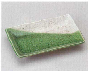
152-16-754 若草山焼物皿 700円 20.9×13×20.7cm 25510752