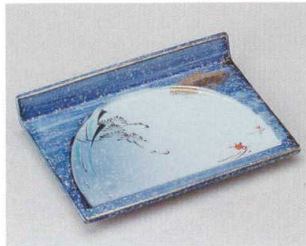
152-1-674 望郷焼物皿 2,900円 21×15×3.6cm 25606673