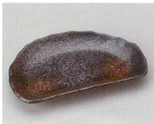
152-22-674 黒油滴半月焼物皿 520円 21×13.2×2.5cm 15222674