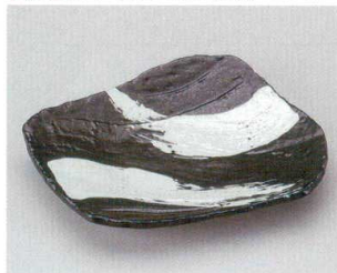
152-10-374 黒炭白刷毛焼き皿(美濃焼) 1,100円 21×17×3.5cm 25901373