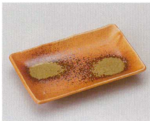
152-21-674 伊賀長角焼物皿 520円 20×12.7×2.8cm 21720671