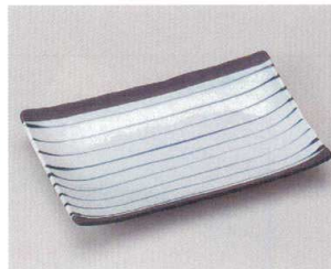
153-10-724 桃山ストライプ7.0焼物皿 1,050円 20.4×13.1×2.2cm 26101723