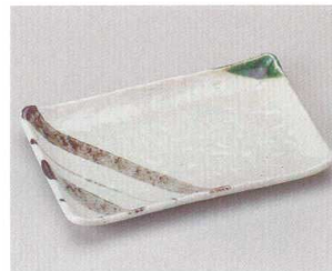
153-15-704 織部ストライプ7.0皿 880円 20.5×13×2cm 25413702