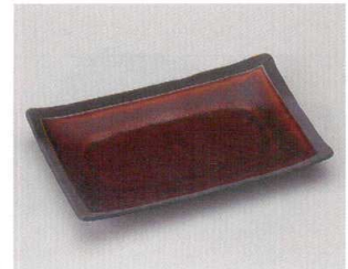
153-12-714 アメ釉7.0長角皿 950円 20.5×13×2.6cm 15312714

細長皿 128P~ 突出皿 焼物皿 142P~ 仕切皿 のり皿 串焼皿 161P~ 盛皿 166P~ 角皿 [鉢鉢類] 174P~