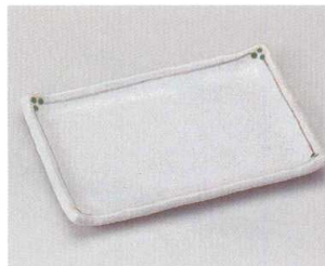
153-6-714 みつば7.0焼物皿 1,250円 20.5×14.4×2.5cm 15306714