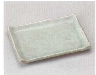
153-8-714 白雲7.0焼物皿 1,200円 20.5×14.4×2.5cm 21406711

盛鉢 14P~ 桶円鉢 組鉢 38P~ 刺身 向付 46P~ 中鉢 小鉢 64P~ 小付 珍珠 100P~