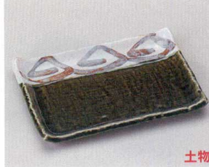
153-2-714 織部ライン7.0焼物皿 1,300円 20.5×14.4×2.5cm 40入 25811783