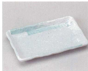
153-14-794 藍刷毛目7.0長角皿 930円 20.4×12.5×2cm 26104793