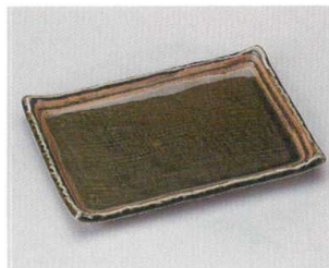
153-5-794 織部ライン7.0長角皿 1,280円 20.4×14×2.2cm 25203792