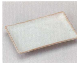
153-19-624 鎗ボカシ7.0長角皿 700円 20.6×13.3×3.5cm 21708621