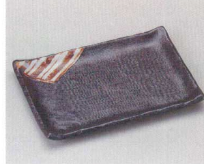
153-3-794 黒伊賀十草7.0長角皿 1,300円 20.5×14.3×2.4cm 25810793