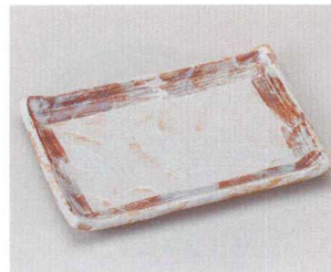
153-7-794 綿ぼうし7.0長角皿 1,250円 20.4×14.5×2.5cm 21315791