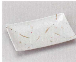
153-11-714 鎗唐草7.0長角皿 990円 20.5×13×2.6cm 26102713