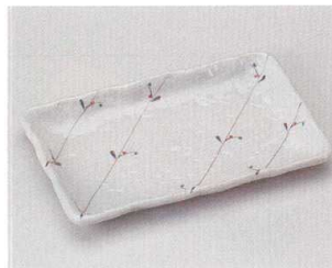
153-9-714 古染メバエ7.0長角皿 1,150円 20.4×12.8×2.1cm 21407711

盛鉢 14P~ 桶円鉢 組鉢 38P~ 刺身 向付 46P~ 中鉢 小鉢 64P~ 小付 珍珠 100P~