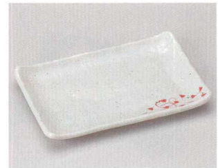
153-16-724 紅志野唐草7.0長角皿 850円 20.5×13×2.3cm 21604721

丸皿 212P~ 和皿 前菜皿 7ル~7並鉢 235P~ 組小皿 小皿 252P~ 有田焼大皿 萬古焼大皿 264P~