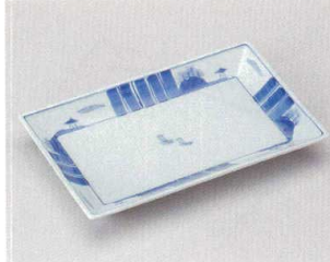
153-1-694 十草山水 焼物皿(有田焼) 1,800円 20.5×12.5×2.5cm 5×12入 26008693