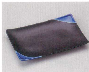
153-13-724 ルリ黒マット7.0焼物皿 950円 20.4×13.1×2.2cm 26103723

細長皿 128P~ 突出皿 焼物皿 142P~ 仕切皿 のり皿 串焼皿 161P~ 盛皿 166P~ 角皿 [鉢鉢類] 174P~