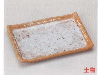
153-4-714 綿ぼうし7.0焼物皿 1,300円 20.5×14.4×2.5cm 21313781