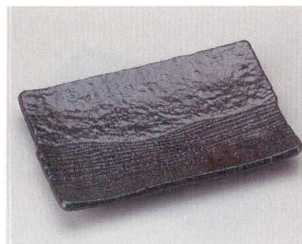
153-17-654 黒染焼物皿 750円 20.7×14×2.6cm 26108653

丸皿 212P~ 和皿 前菜皿 7ル~7並鉢 235P~ 組小皿 小皿 252P~ 有田焼大皿 萬古焼大皿 264P~