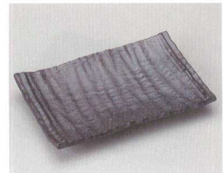
153-20-524 いぶし黒焼物皿 650円 20.7×13×3cm 21706521

組皿 (大) 270P~ 天皿 香水 取鉢 280P~ 松花堂 288P~ 蕨向 煮物碗 円菓子碗 298P~ むし碗 306P~