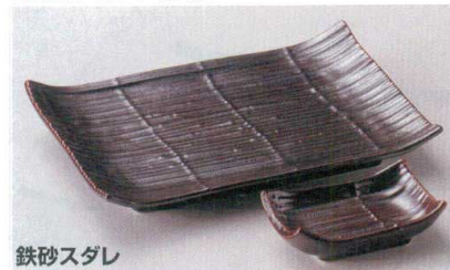
鉄砂スタレ 159-25-714 8.0焼物皿 1,100円 20.5×14.2×3cm 26909713 159-26-714 長角小皿 360円 9.2×6×2.7cm 26910713