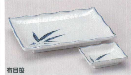
布目笹 159-23-624 7.0焼物皿 1,150円 21.2×15.1×3cm 15923624 159-24-624 長角千代久 440円 8.7×7×2.5cm 15924624