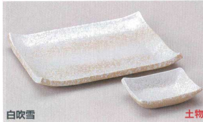
白吹雪 土物 159-7-794 8.0焼物皿 1,900円 21×15.3×2.7cm 15907794 159-8-794 長角小皿 630円 9.3×6.9×2.6cm 15908794