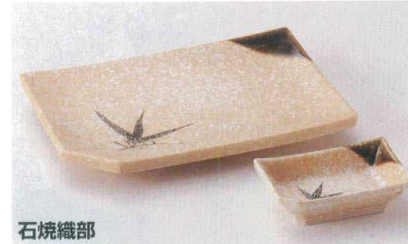
石焼織部 159-21-624 7.0焼物皿 1,350円 21×14.3×2.5cm 22107621 159-22-624 長角千代久 490円 9.6×6×3cm 22108621