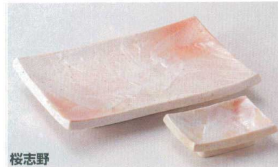
桜志野 159-19-624 焼物皿 1,390円 21×14.5×2.5cm 22011621 159-20-624 長角千代久 490円 9.5×7×2.4cm 22012621