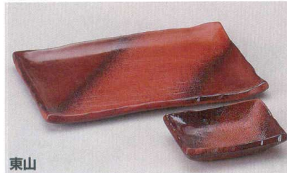
東山 159-13-794 7.0焼物皿 1,550円 20.8×13.6×5cm 15913794 159-14-794 千代久 660円 9.5×7.2×2.2cm 15914794