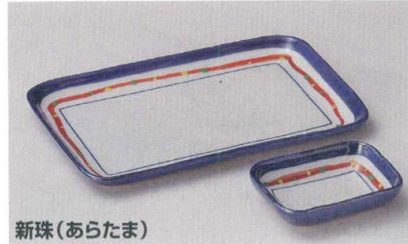
新珠(あらたま) 159-3-794 8.0長角皿 2,000円 21×13.5cm 54177791 159-4-794 長角小皿 580円 8.8×6.5cm 54178791