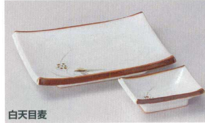
白天目麦 159-9-204 焼物皿 1,850円 20.5×14.5cm 56771201 159-10-204 長角千代久 600円 10×6.5cm 56772201