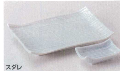
スタレ 159-27-714 8.0焼物皿 1,100円 20.5×14.2×3cm 22307711 159-28-714 千代久 360円 9.3×6×2.7cm 22308711