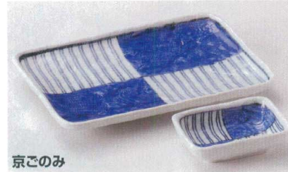
京ごのみ 159-15-734 焼物皿 1,530円 21×14.2×2.3cm 22105731 159-16-734 長角千代久 530円 9×6.5×2.5cm 22106731