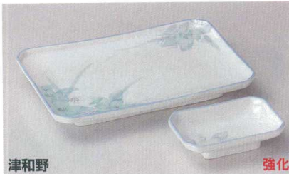
津和野 強化 159-1-204 四ツ切焼物皿 2,500円 20.9×14×2.8cm 53732201 159-2-204 四ツ切角千代久 870円 10.3×6.7×2.7cm 53728201