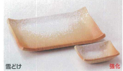
雪どけ 強化 159-5-704 焼物皿 1,950円 21.3×15.6×2.7cm 26613703 159-6-704 角千代久 670円 9.3×6.8×2.5cm 26614703