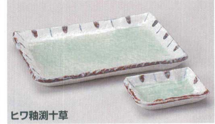
ヒワ軸測十草 159-17-704 7.0焼物皿 1,470円 20.8×14.6×2.1cm 15917704 159-18-704 千代久 490円 10×7.7×2cm 15918704