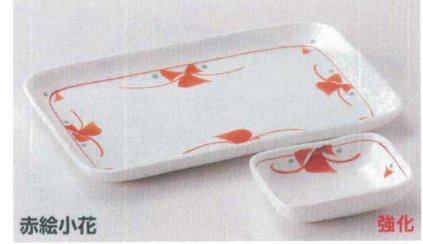
赤絵小花 強化 159-11-714 8.0焼物皿 1,600円 20.5×13.3×1.6cm 26805783 159-12-714 長角小皿 600円 9×6.5×2cm 26806783