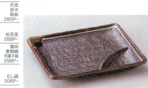
162-12-724 瀏織部十草7.0仕切皿 720円 17.3×15.2×2.4cm 23511721