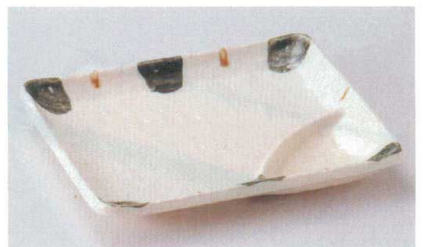
組皿 (大) 270P~ 162-10-754 鉄釉一珍ライン串皿 800円 22×12.1×2.5cm 26414752