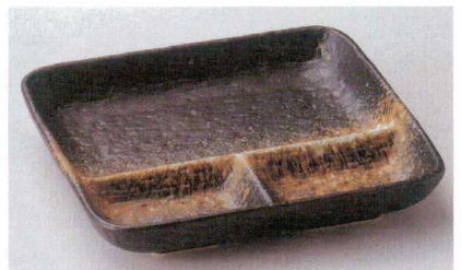
楕円皿 206P~ 162-7-624 織部がすり7.0仕切皿 1,050円 21×13×3cm 26410602