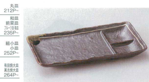
162-9-514 黒備前7.0三ツ切皿 890円 17.4×16.6×3cm 23507511