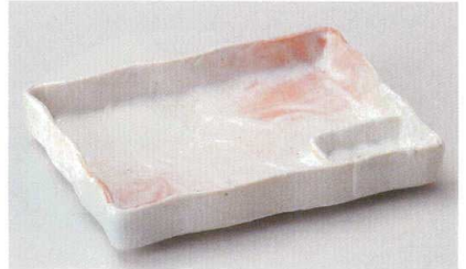
盛鉢 14P~ 162-1-194 いろり正角仕切皿 1,580円 16.8×16.8×2.8cm 16201194