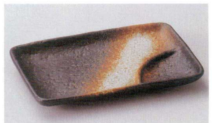
162-13-754 鉄釉一珍ライン7寸仕切皿 680円 17×14.8×2.4cm 26513752