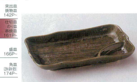
162-6-624 緑彩芦7.0仕切皿 1,050円 21×13×3cm 50入 23502601