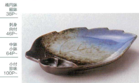
162-3-624 桜志野長角仕切皿 1,320円 18×14.3×2.8cm 16203624