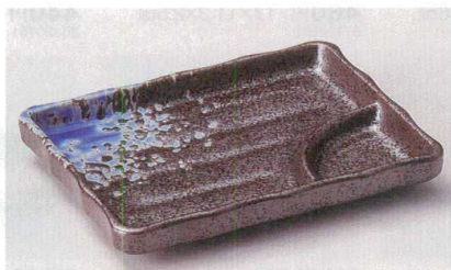
163-15-724 鉄仙花ルリ5.5長角仕切皿 920円 14×10.8×1.9cm 16315724