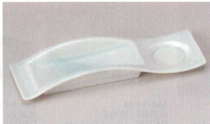
163-2-284 青磁2ピース長角皿 1,300円 25.2×8×3.5cm 60入 26917282