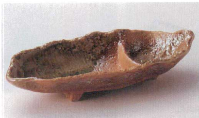
163-1-514 織部砂目仕切鉢 1,500円 23×10×4.6cm 23406511