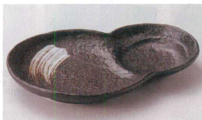
163-5-154 備前風白刷毛仕切皿 1,040円 21.5×15.6×3.1cm 27105153