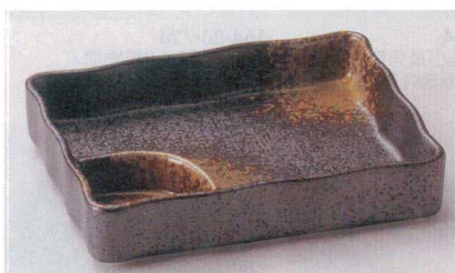
163-11-674 黒伊賀仕切皿 630円 14.8×11.7×3cm 27011673