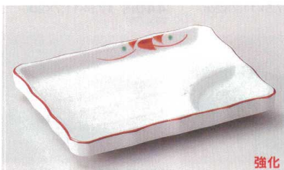
163-14-714 赤絵小花5.5仕切り皿 1,100円 13.5×10.5×2cm 16314714