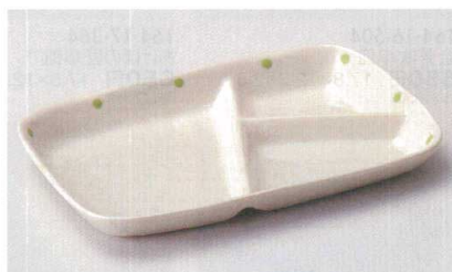
163-13-724 ドットグリーンスパイシープレート 590円 18.2×11.8×1.9cm 16313724