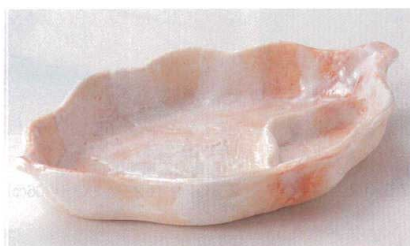
163-4-624 桜志野菜型仕切皿 1,140円 21.6×13×2.8cm 23417621