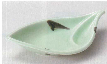
163-3-284 緑葉千代口付皿 1,250円 23×13.5×4.5cm 40入 16303284