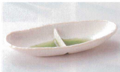
163-8-374 粉引グリーン仕切り長盛鉢(美濃焼) 800円 22×9.8×3.6cm 27111373