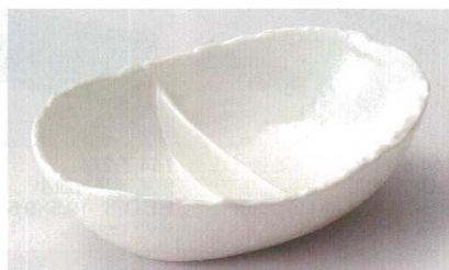
163-6-674 アイボリー楕円5.0仕切鉢 1,050円 17.2×13×5cm 16306674 163-7-674 アイボリー楕円4.0仕切鉢 700円 15.4×11×3.5cm 16307674