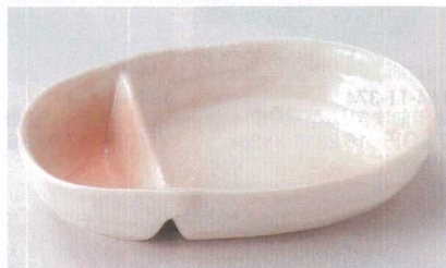
163-10-674 桃吹き仕切鉢 590円 17×13×3cm 27108673