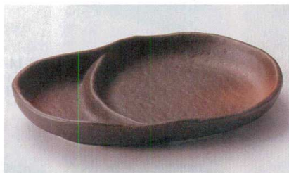
163-9-204 黒伊賀仕切皿 930円 17.2×12.2×2.5cm 23508201