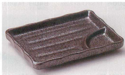
163-16-714 鉄仙花5.5仕切り皿 630円 13.5×10.5×2cm 16316714