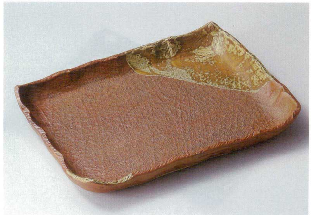
168-4-714 南蛮長角大皿 7,700円 37×28×4.5cm 13004711