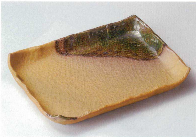
168-5-714 伊賀長角大皿 7,700円 37×28×4.5cm 13006711