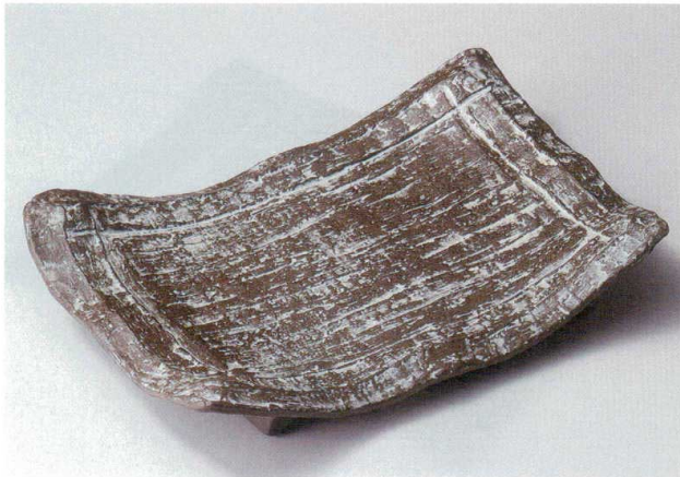
168-3-554 炭化土白化粧尺二寸盛皿 7,700円 37.2×26.5×5.6cm 12人 12604551