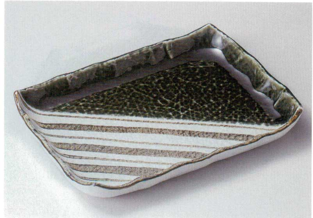
168-2-704 織部ストライプ長角大皿 7,800円 37×27.5×4.5cm 16802704