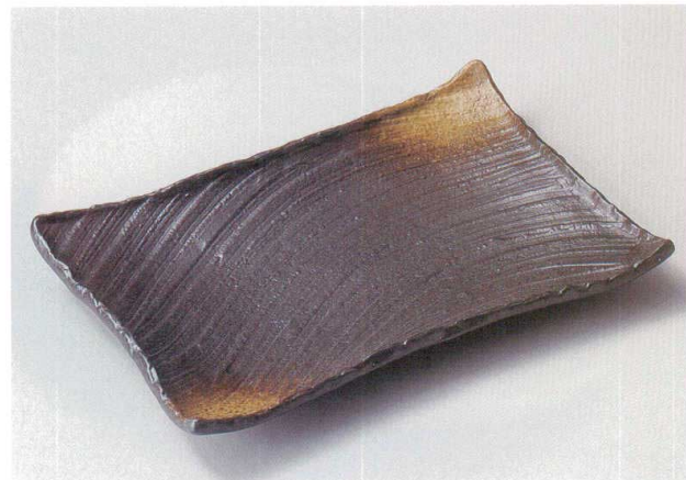
169-6-634 備前吹き枯山水角皿(中) 4,600円 31×21×4cm 14018632 169-7-634 備前吹き枯山水角皿(小) 2,800円 26×17.5×3.5cm 14019632