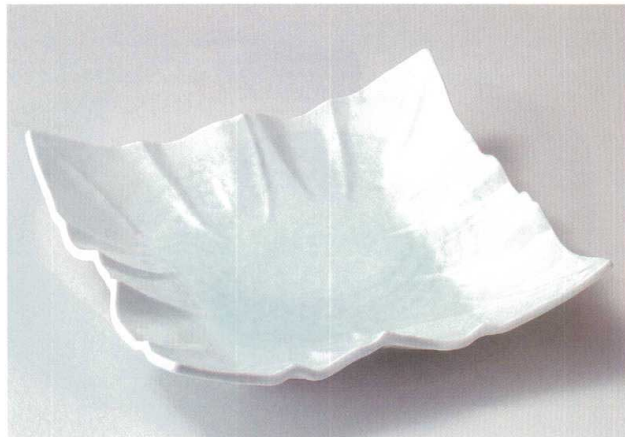
169-2-524 青白磁折り紙尺一寸皿 9,600円 32.3×32.3×9cm 15605523