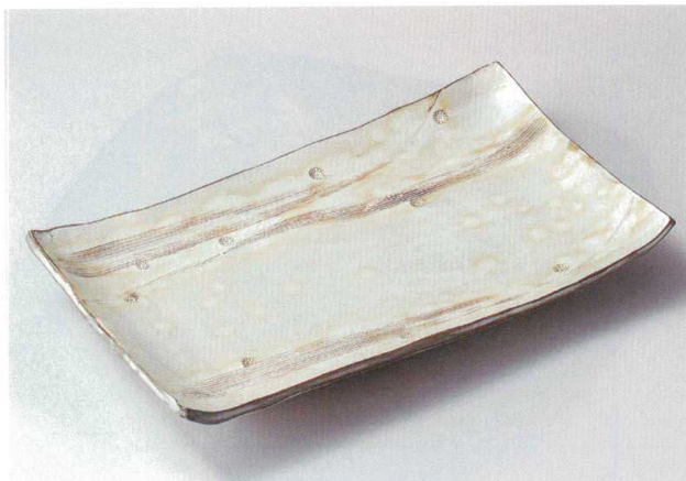
169-1-274 鈴木窯くし目まな板皿 15,000円 36.5×22×4.5cm 53510272