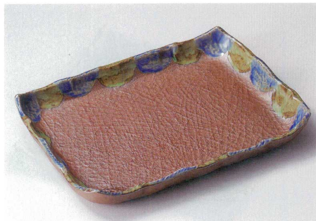
169-3-794 きらめき長角大皿 7,800円 36.5×27.5×4.7cm 15402793