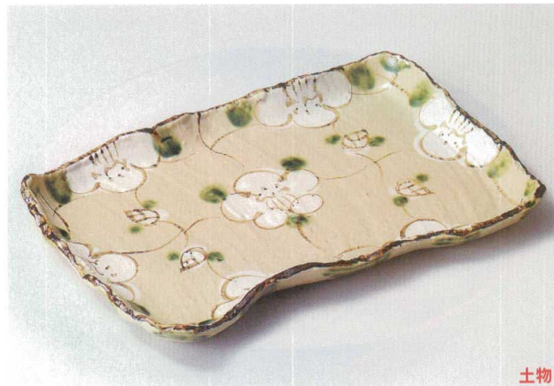
169-4-554 格子花変形長角皿 5,700円 37×24.5×3.5cm 13108551