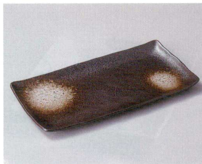
182-12-354 黒水晶ホッケ皿 1,130円 34×17.7×2.5cm 20311351