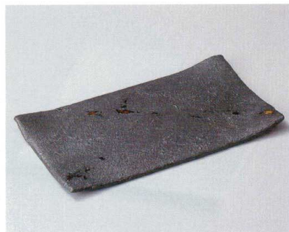
182-4-504 錆長角皿 6,500円 33.5×19×1.8cm 18204504