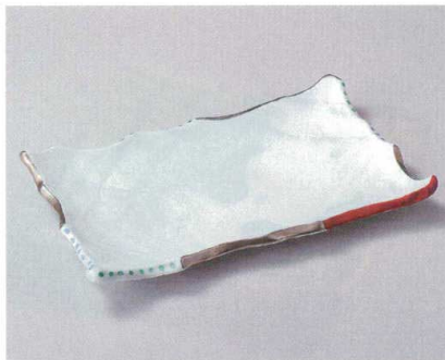
182-5-524 色絵銀彩舞長角大盛皿 5,400円 35.5×22×3.5cm 13302521 182-6-524 色絵銀彩舞長角皿 2,800円 26.5×17×3.7cm 20613521