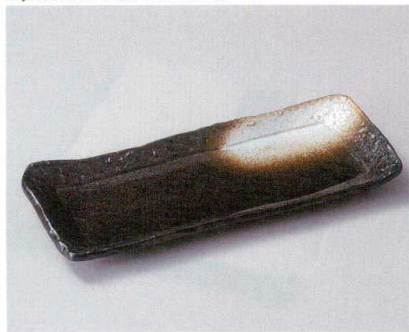
182-9-204 黒備前石目焼物皿 2,080円 33.5×14×3.5cm 16812203