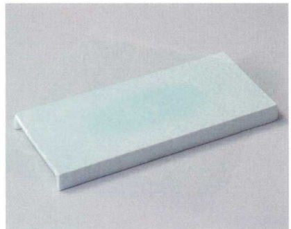
182-7-554 青磁長角寿司皿 4,650円 36×15.7×2.7cm 14007552