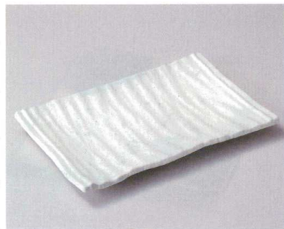
182-8-524 白マット長角大皿 2,650円 33.3×21.2×3cm 16609523