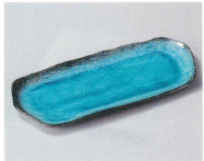
182-10-284 スカイホッケ皿 1,980円 36.5×16.5×2.5cm 16入 18210284