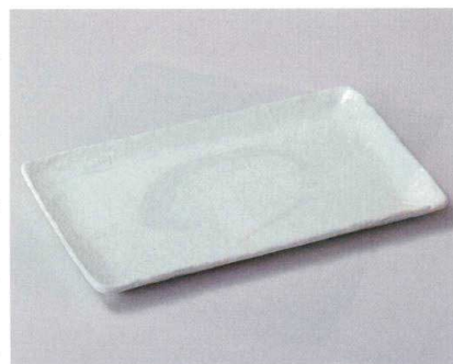
182-11-504 アジアン粉引長角大皿 1,600円 33.5×20.8×2.3cm 19505501