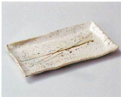
184-7-724 アメ流し櫛目長角大皿 1,720円 31.5×17.2×2.3cm 18407724