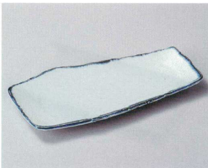
184-8-504 白均窯ちぎり焼物皿 1,650円 32×16×2.7cm 18408504