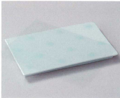
184-2-554 青磁レール盛皿 3,750円 31×19.8×3.3cm 14008552