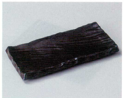
184-6-524 黒備前荒彫まな板皿 1,980円 32.3×15.9×3cm 16903523

細長皿 128P~ 突出皿 焼物皿 142P~ 仕切皿 のり皿 串焼皿 161P~