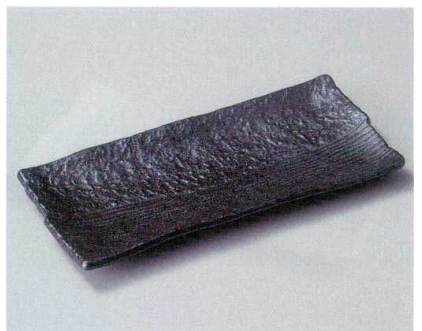
184-9-654 黒楽ほっけ大皿 1,600円 32.5×15.5×3.2cm 16908653

精円皿 206P~ 丸皿 212P~ 和皿 前菜皿 フルーツ皿 235P~ 組小皿 小皿 252P~