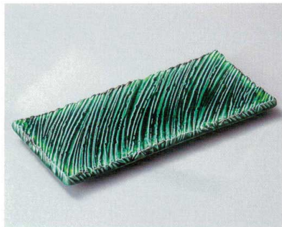
184-4-554 緑釉黄流しのぎ長角10.0皿 2,200円 32.5×14.7×2.9cm 16809553