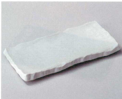
184-5-524 白マット荒彫まな板皿 1,980円 32.3×15.9×3cm 16902523