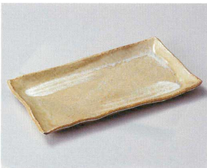
184-11-714 黄灰釉ホッケ皿 1,500円 31.3×16.8×2.5cm 21704712