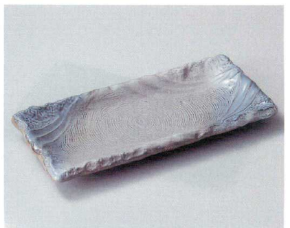
184-12-814 淡雪ホッケ皿(萬古焼) 1,400円 32×15×3.5cm 21909812