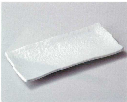
184-10-654 白楽ほっけ大皿 1,600円 32.5×15.5×3.2cm 16909653