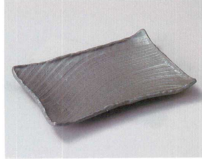
185-5-214 渋緑結晶31長角皿 3,700円 31×21×4cm 18505214