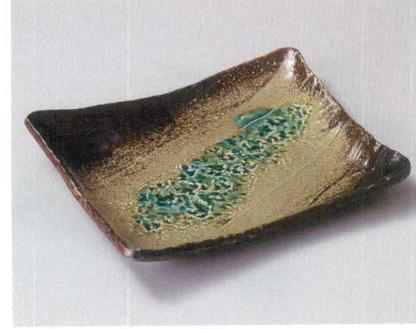
185-9-554 和三彩手作り角大皿 3,500円 30.5×25.5×5cm 15入 13508551