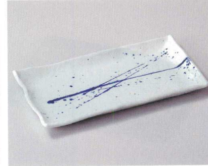
185-15-654 呉須吹長角皿 1,800円 31×16.5×2.5cm 21701652