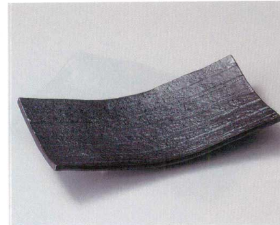
185-14-204 南蛮まな板皿 2,700円 31×15.8×3.4cm 19504201