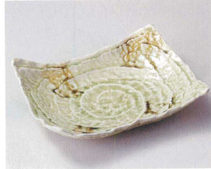
185-8-284 ビードロ四方上がり長角皿 3,700円 30.7×23.5×7.7cm 20入 13609282