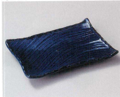
185-6-214 紺ナマコ31長角皿 3,700円 31×21×4cm 18506214 185-7-214 紺ナマコ26長角皿 2,400円 26×17.5×3.5cm 18507214