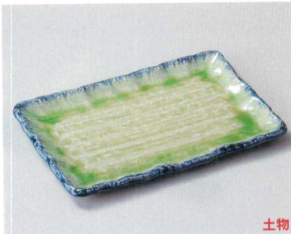
185-1-724 灰釉流し10.0盛皿 3,830円 30.6×20.6×2.8cm 19404721 185-2-724 灰釉流し9.0焼物皿 2,700円 26.1×16.5×2.6cm 22231721