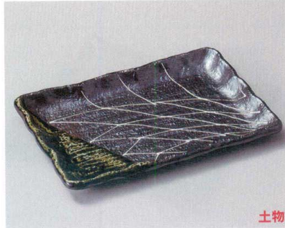
185-3-724 一珍掛アミ10.0盛皿 3,830円 30.6×20.6×2.8cm 19405721 185-4-724 一珍掛網9.0焼物皿 2,700円 26.1×16.5×2.6cm 21926721