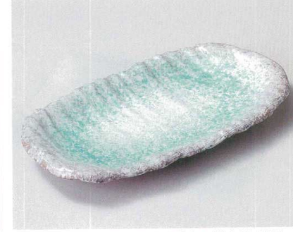
185-16-814 青釉10号波形長角皿(細)(萬古焼) 1,400円 31×17×3.5cm 18109813