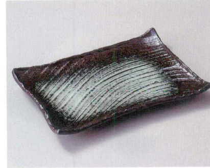
185-11-114 おぼろ月角皿 大 3,550円 31×21×4cm 18511114 185-12-114 おぼろ月角皿 中 2,350円 26×17.5×3.5cm 18512114