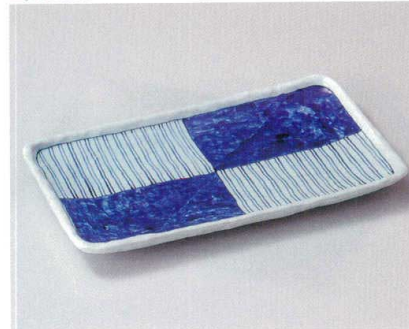
185-10-734 京ごのみ12.0長角大皿 3,450円 31×18×2.5cm 19407731