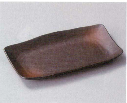
186-12-624 備前ホッケ皿 2,060円 29.7×17.3×3.3cm 20303621