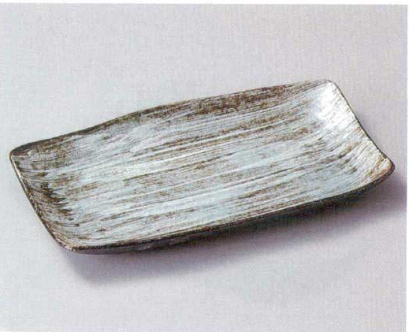
186-11-624 白刷毛ホッケ皿 2,090円 30×17×3.3cm 18611624