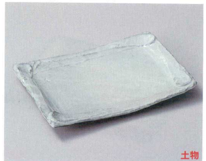
186-4-214 炭化白化粧長角皿 3,700円 29×20.2×3.2cm 17108213