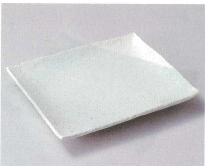
186-9-714 ソバ志野角盛皿 3,100円 30×26.2×3.5cm 13712712