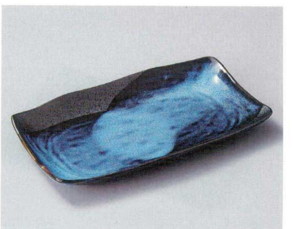
186-13-634 清流ホッケ皿 1,900円 29.5×17.5×3.5cm 20305611