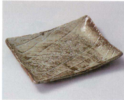
186-3-274 越前角大皿 3,750円 29.7×24.7×4.3cm 13901271