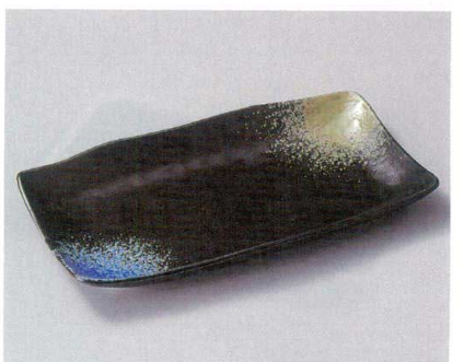
186-10-624 しぶきホッケ皿 2,170円 29.7×17.3×3.3cm 20213621