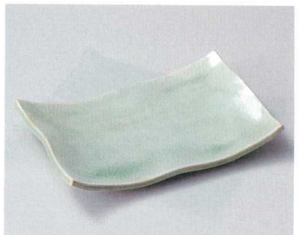
186-7-714 白雲9.0四ツ足皿 3,400円 28.7×18.7×4cm 19408711