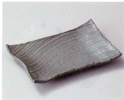
188-7-214 渋緑結晶26長角皿 2,400円 26×17.5×3.5cm 18807214