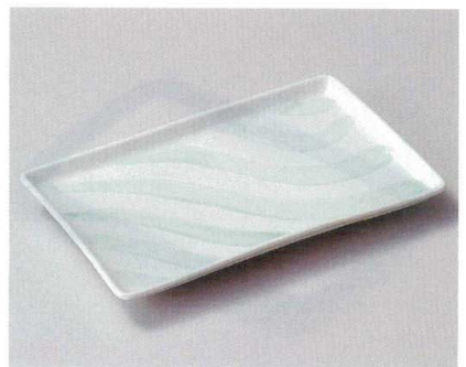
188-6-714 流水10.0皿 2,450円 26.2×16.2×2.7cm 21902712