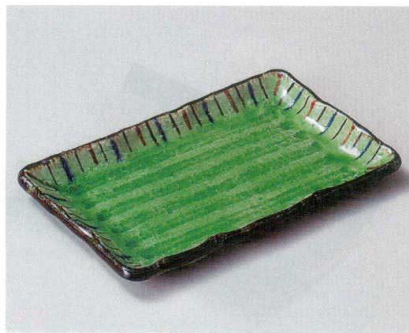
188-5-714 三色淵十草9.0長角皿 2,650円 26.4×16.6×2.3cm 17206713