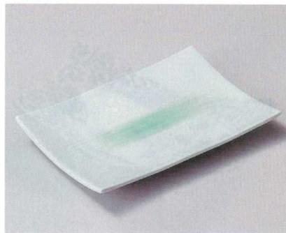
188-2-184 緑釉手彫り焼物皿 4,050円 24.5×16.4×3.2cm 20412181