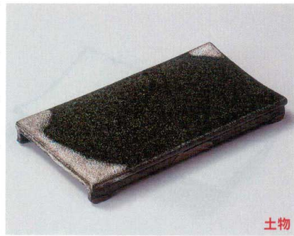
188-4-214 黒鉄釉まな板皿 3,100円 26×13×2.8cm 24707212