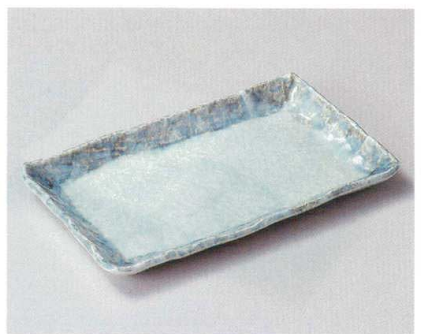
188-9-794 淡青9.0長角皿 2,000円 26×15.8×2.3cm 24503792