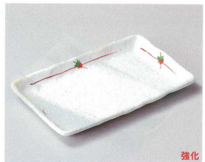
188-3-704 赤絵志野9.0長角皿 3,700円 25.5×16.2×2.3cm 20512701