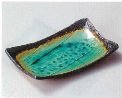
188-10-274 緑彩長角皿 1,800円 26×16.5×4.5cm 21907272