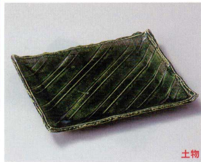
188-1-704 織部手おこし長角皿 8,500円 26×21×3.2cm 19401701