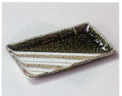
188-12-704 織部ストライプ9.0長角皿 2,100円 26.5×15.9×2.5cm 18812704