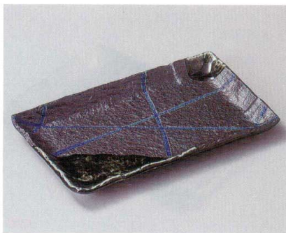
188-8-704 南蛮乱十草9.0長角皿 2,100円 26.3×15.9×2.3cm 20302701