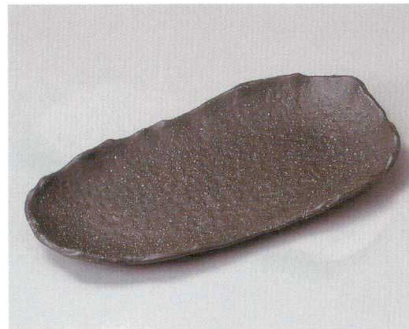
190-12-184 星空34cm長皿 2,100円 34×18.5×3.1cm 21608182