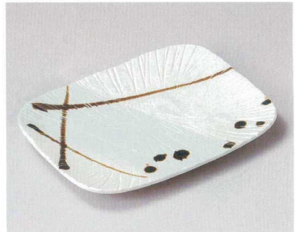
190-13-754 金色流し盛皿 1,600円 25.8×19.8×3cm 19013754