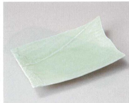
190-11-724 もえぎさざなみ盛皿 2,700円 29.2×19.6×5.4cm 20211721