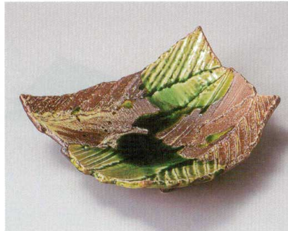
190-5-284 サビ釉ヒワ流スジ彫変形盛皿 3,350円 26.5×24×7.5cm 12入 19005284