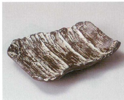
190-8-554 炭化土白化粧変形8.5寸皿 4,200円 25.5×20.5×5cm 30入 17811551