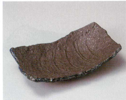
190-4-554 炭化土プラチナ流し彫込長角皿 大 4,650円 30×20×6.8cm 17102553