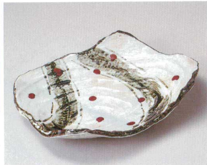
190-1-554 錆絵辰砂渦彫11.0盛込皿 6,270円 35×27×6.5cm 13106551