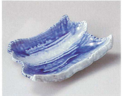
190-6-214 藍流しチギリ皿 3,100円 27.7×18.5×6.5cm 18007213