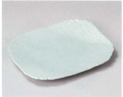
190-3-054 青白磁・屋久島大皿 4,100円 32×26.5×2.8cm 16314053