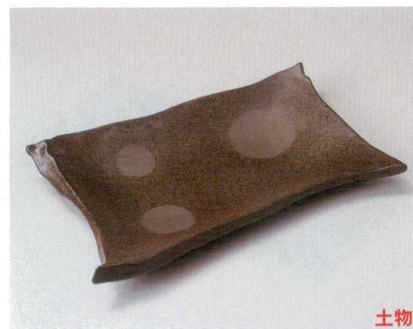
190-7-524 炭化土ちぎり長盛皿 5,400円 35.5×23×4.5cm 13404521