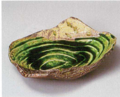
190-2-284 サビ釉ヒワ流渦彫尺一寸盛皿 5,900円 35.5×27.5×7.7cm 12入 19002284