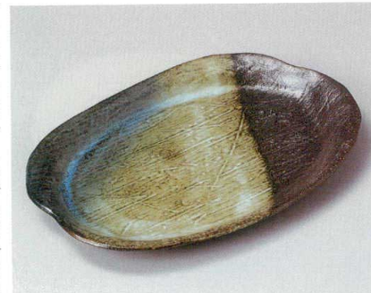
192-3-554 焼メ灰釉流し片上り8.5寸皿 3,750円 26×25.5×7.5cm 20入 14606551