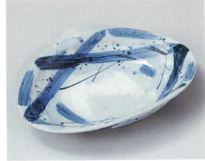
192-7-374 織部しぶぎ盛皿 3,000円 29×19.2×4.5cm 14504372