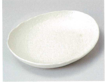
192-4-514 森の湖多用大皿 4,000円 35×25.5×2.5cm 19204514