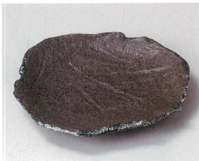
193-1-554 炭化土プラチナ流し彫込変形皿 4,500円 27.2×26.5×3.8cm 17402553