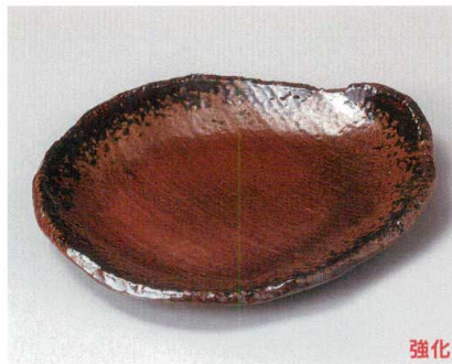
193-5-714 みのり変型9.0皿 4,100円 28×24.8×3.5cm 19305714