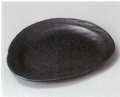
193-10-524 黒結晶フリープレート(大) 2,400円 29.5×25×2.7cm 24603521