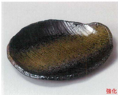
193-4-714 黒緑彩変形9.0皿 4,100円 28×24.8×3.5cm 20入 17412783