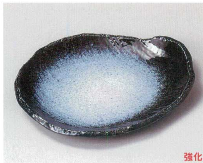
193-2-714 雲海9.0変型皿 4,400円 28×24.5×3.5cm 55415781