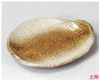
193-3-734 金茶吹変形9.0皿 4,320円 28×24.5×4cm 17414733