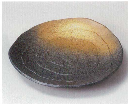
193-11-054 黒備前吹三角9.0皿 1,700円 27×27×4cm 15105051