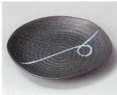
193-8-504 結び天目四角丸深皿 3,600円 27.8×3.7cm 19308504