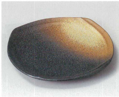
193-12-504 黒備前風車9.0皿 1,550円 25.7×25.7×3cm 19312504