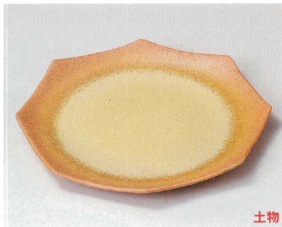
193-7-554 伊賀八角皿 4,050円 24.4×2.5cm 18205551