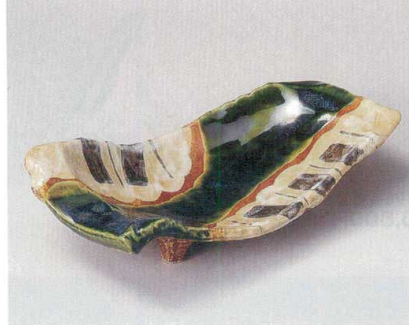
195-2-204 織部重ね錆十草8.0盛鉢 3,300円 24.3×12×6cm 22412201