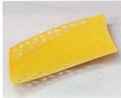
195-5-214 黄釉七宝前菜皿 3,000円 25.5×14.5×3.3cm 18006213