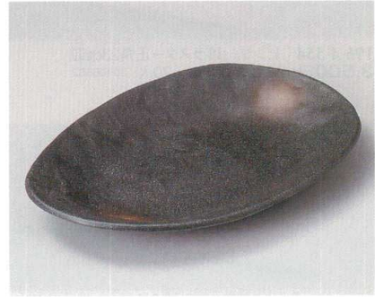
195-6-274 備前マルチプレート 大 2,350円 27.2×18.1×3.4cm 24704271