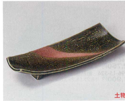
195-8-704 織部三角紋反型焼物皿 1,780円 28.8×11×5cm 22712701