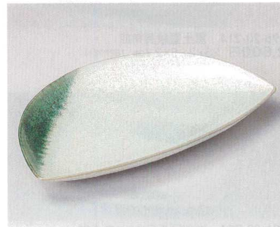
195-11-354 カイラギ織部半月焼物皿 1,130円 25.5×15.3×2.9cm 21403351