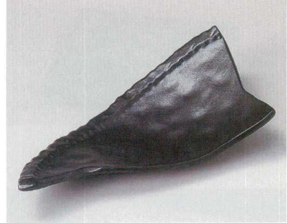
195-3-284 炭化土いぶし陶片9寸皿 2,800円 31×16×6.5cm 20入 17902282