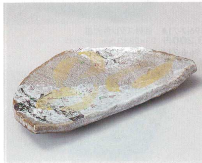
195-4-204 乾山春秋半月前菜皿 2,750円 24.5×13.5×3.2cm 20704201