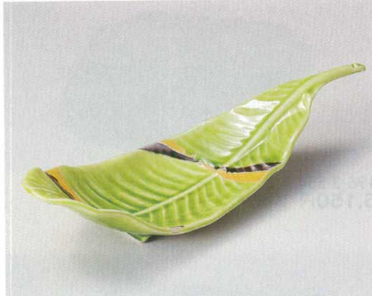
195-1-214 萌黄葉型長皿 3,800円 30.3×10.2×8cm 19501214