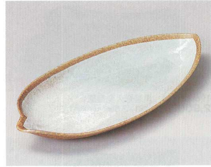
195-9-274 伊賀化粧花型長皿 1,650円 30×15×3.2cm 19407273