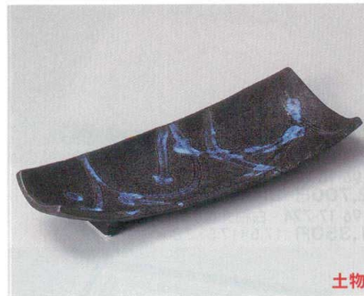
195-7-704 乱格子反型焼物皿 1,780円 28.8×11×5cm 22710701