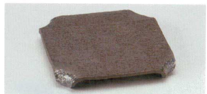
196-3-554 炭化土四隅プラチナ付高台皿 5,150円 24×24×3.5cm 18202553

盛鉢 14P~ 楕円鉢 細鉢 38P~ 刺身 向付 46P~ 中鉢 小鉢 64P~ 小付 珍珠 100P~