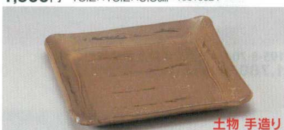
196-20-214 黒土雲紋長角皿 2,600円 23×21.5×2.7cm 18210211