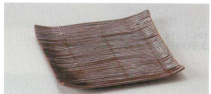
196-7-714 鉄砂スタレ角大皿 3,300円 23×23×3.3cm 18217713 196-8-714 鉄砂スタレ正角皿 1,400円 18×18×2.7cm 18218713

細長皿 128P~ 突出皿 焼物皿 142P~ 仕切皿 のり皿 串焼皿 161P~