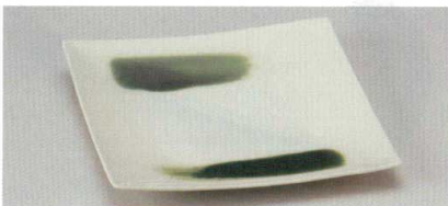
196-23-724 織部刷毛目スクエア大皿 2,160円 23×23×3.5cm 18414721