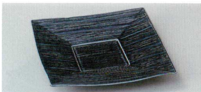
196-14-524 紺釉筋彫正角皿(大) 2,750円 23.6×23.6×3.2cm 19614524 196-15-524 紺釉筋彫正角皿(小) 1,900円 18.2×18.2×3.5cm 19615524