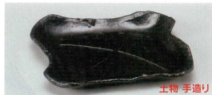
196-13-214 黒碧彫入変型皿 2,900円 24×21×3.5cm 18408211