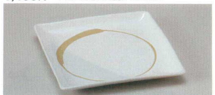
196-16-724 白釉丸抜10.0正角皿 2,700円 23×23×3cm 20418722 196-17-724 白釉丸抜6.0正角皿 1,350円 17.5×17.5×2.8cm 20419722

丸皿 212P~ 和皿 前菜皿 外〜内皿 235P~ 細小皿 小皿 252P~ 有田焼大皿 真古焼大皿 264P~ 組皿 (大) 270P~