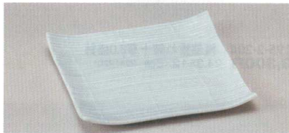
196-5-714 スタレ大皿 3,300円 23×23×3.3cm 18219713 196-6-714 スタレ正角皿 1,400円 18×18×2.7cm 18220713