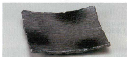
196-18-054 凜黒備前東山23cm正角皿 2,400円 23.5×23.5×3cm 17915051 196-19-054 凜黒備前東山19cm正角皿 1,350円 18.5×18.5×3.5cm 17914051

丸皿 212P~ 和皿 前菜皿 外〜内皿 235P~ 細小皿 小皿 252P~ 有田焼大皿 真古焼大皿 264P~ 組皿 (大) 270P~