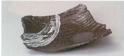
196-10-524 炭化土黒翔三ッ足変形前菜皿 3,000円 23.5×19.5×5cm 19610524