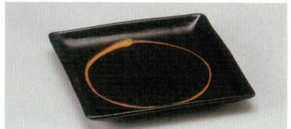
196-11-724 黒釉丸抜10.0正角皿 2,950円 23×23×3cm 20413722 196-12-724 黒釉丸抜6.0正角皿 1,490円 17.5×17.5×2.8cm 20414722