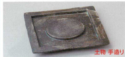
196-1-524 焼ゞ正角皿(大) 6,800円 24×24×3cm 19601524