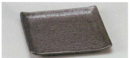
196-24-054 木肌正角皿 1,980円 23.8×23.8×2cm 18312051