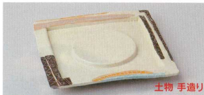
196-2-524 古代紋正角皿(大) 6,800円 24×24×3cm 19602524