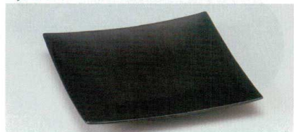
196-22-724 黒釉スクエア大皿 2,160円 23×23×3.5cm 18417721