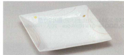
196-4-554 ピンク〜珍ラスター正角23cm皿 3,500円 23×23×2.5cm 20入 20406552

盛鉢 14P~ 楕円鉢 細鉢 38P~ 刺身 向付 46P~ 中鉢 小鉢 64P~ 小付 珍珠 100P~