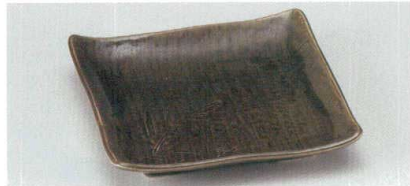
201-16-624 織部かすり正角菜皿 1,050円 18×18×3cm 50入 18919601