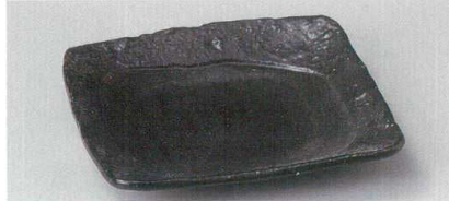
201-13-504 彫刻黒釉正角皿 1,350円 18.5×18.5×3.5cm 20113504