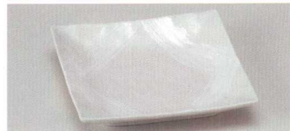
201-14-364 白格子正角皿 1,080円 18.5×18.5×3cm 18922361