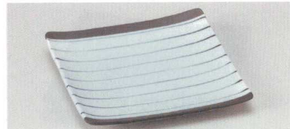
201-11-724 桃山ストライプ6.0正角皿 1,580円 18×18×2.5cm 18714723