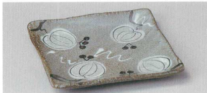
201-10-714 山帰来正角前菜皿 1,770円 18×18×2.5cm 20110714