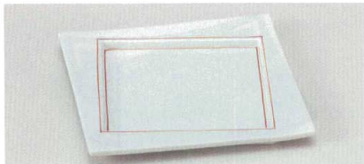
201-2-204 赤ライン四角皿 2,450円 18.1×18.1×1.6cm 21004202