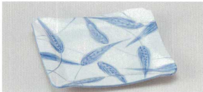
201-3-214 みのり角皿 2,400円 18.2×18.2×2cm 18610213