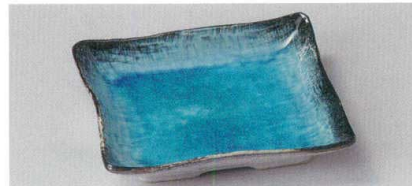
201-18-284 スカイ18cm正角皿 900円 18×18×3.5cm 30入 20118284