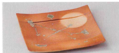
201-7-524 焼〆満月筋彫正角皿 1,900円 18.3×17.1×2cm 20107524