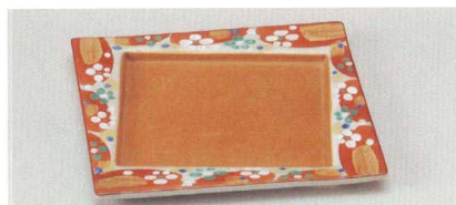
201-4-214 梅花角皿 2,200円 18×18×1.2cm 18819211