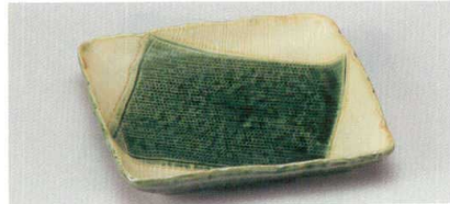
201-19-524 塗分け織部18cm正角皿 850円 18×18×2.9cm 21118522