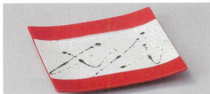
201-5-524 黒飛ばしラスター赤釉筋彫正角皿 2,200円 18×16.8×2.2cm 20105524