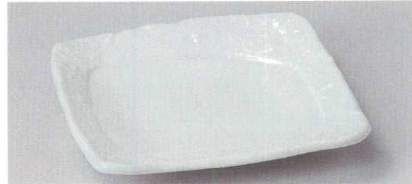
201-12-504 彫刻白釉正角皿 1,350円 18.5×18.5×3.5cm 20112504