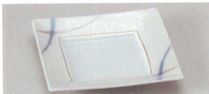
201-1-554 パールラスター2色吹正角6.0皿 2,800円 18.3×18.3×3cm 40入 18614551