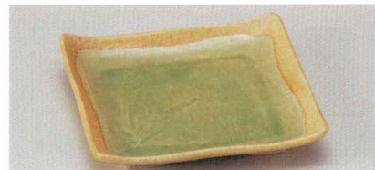
201-17-624 緑彩芦正角菜皿 1,080円 18×18×3cm 50入 18920601