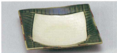
201-6-524 瀏織部正角皿 2,300円 18×18×2.6cm 18611523